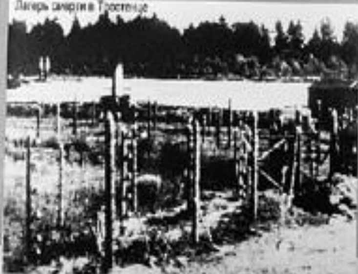
Лагерь смерти в Тростенце