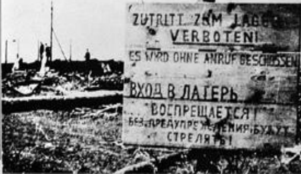
Вход в лагерь