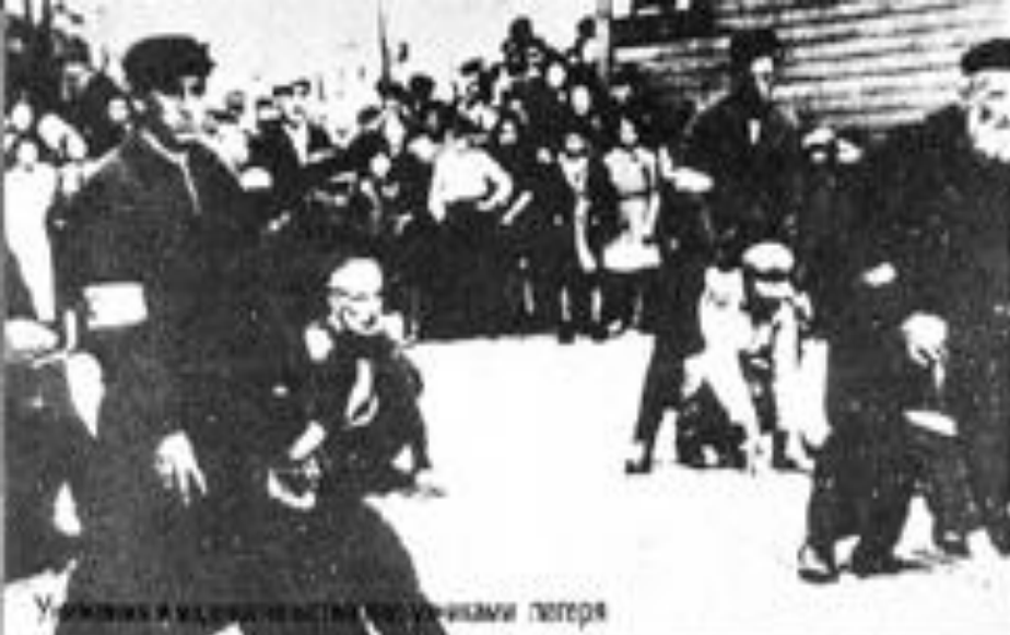
Упаковки и продукты выстроены рядами лагеря