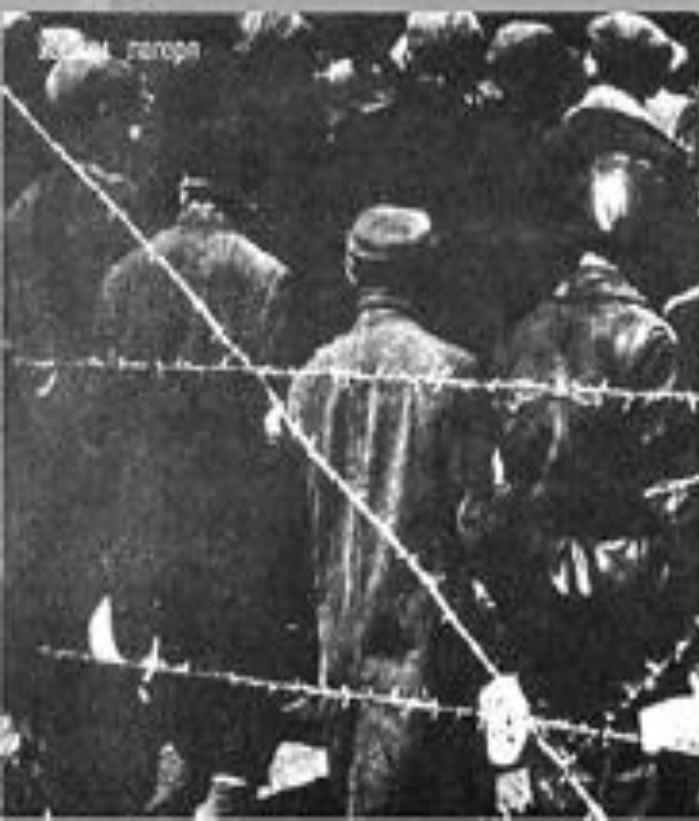
Вход в лагерь