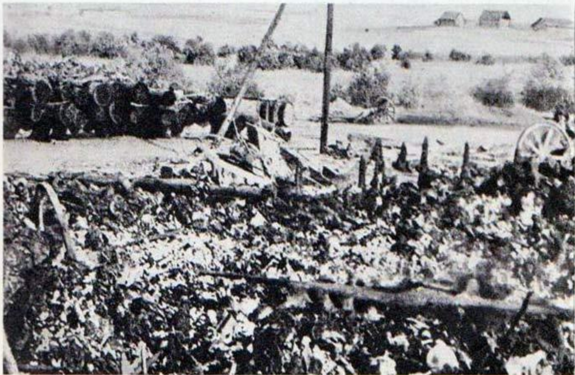
Лагерь смерти Тростенец. На фото — место бывшего колхозного амбара, в котором гитлеровские оккупанты сожгли более 6500 человек (1944 г.)