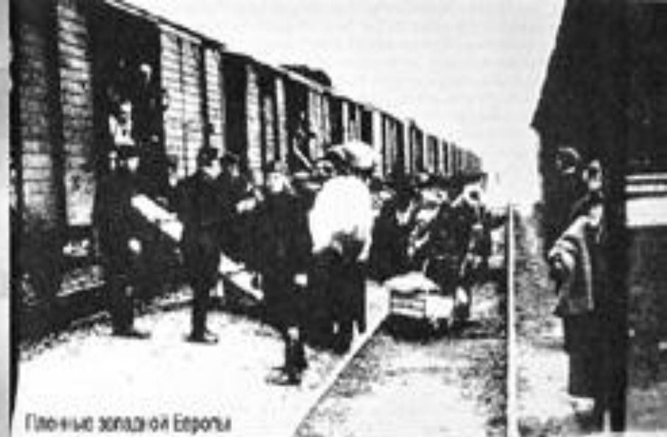
Площадь западной Европы