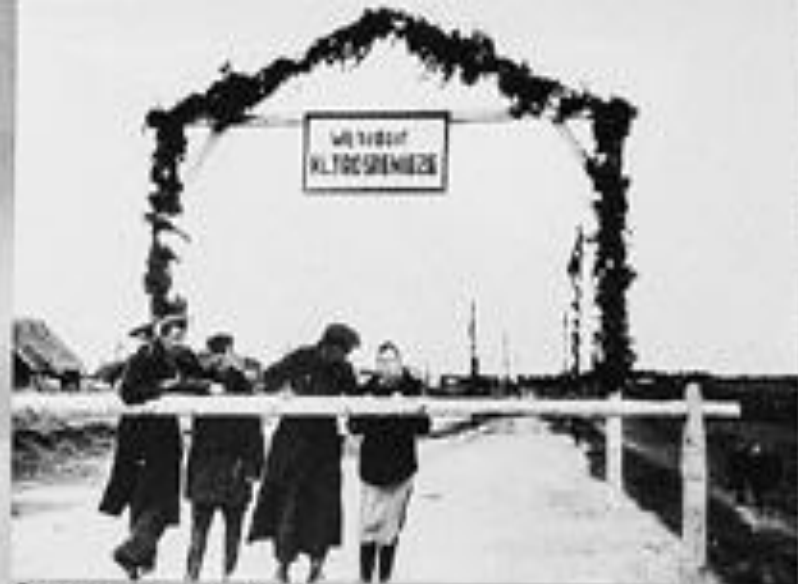
Лагерь смерти в Тростенце