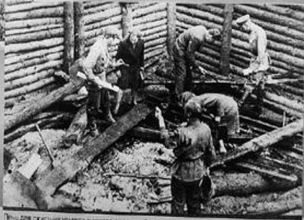
Течи для скотных узиас в лагерь смерти в Тростенце