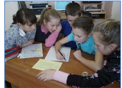
Команда «Дерево», 6 кл.