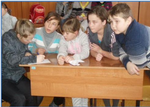
Команда «Радуга», 5 кл.