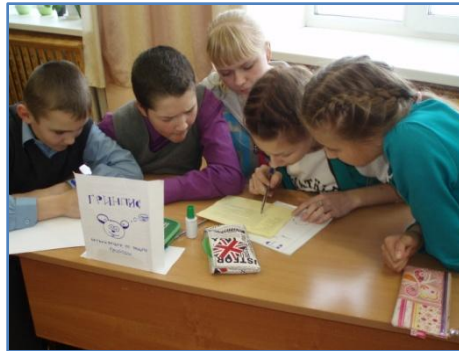
Команда «Гринпис», 7 кл.