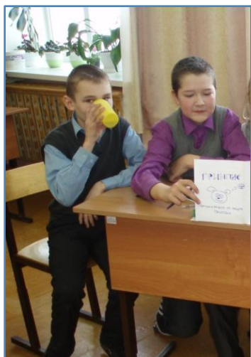
Пили травяной чай