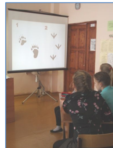
Команды разгадывали следы животных и птиц