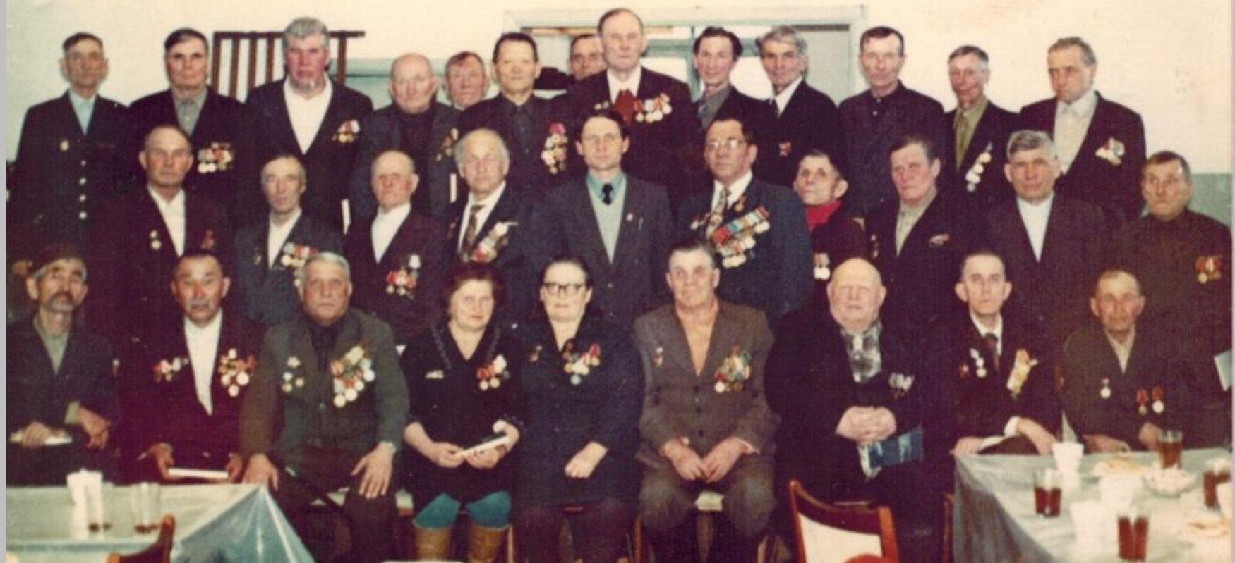
Фото сделанное после войны на 9 мая. Ветераны Великой Отечественной Войны.