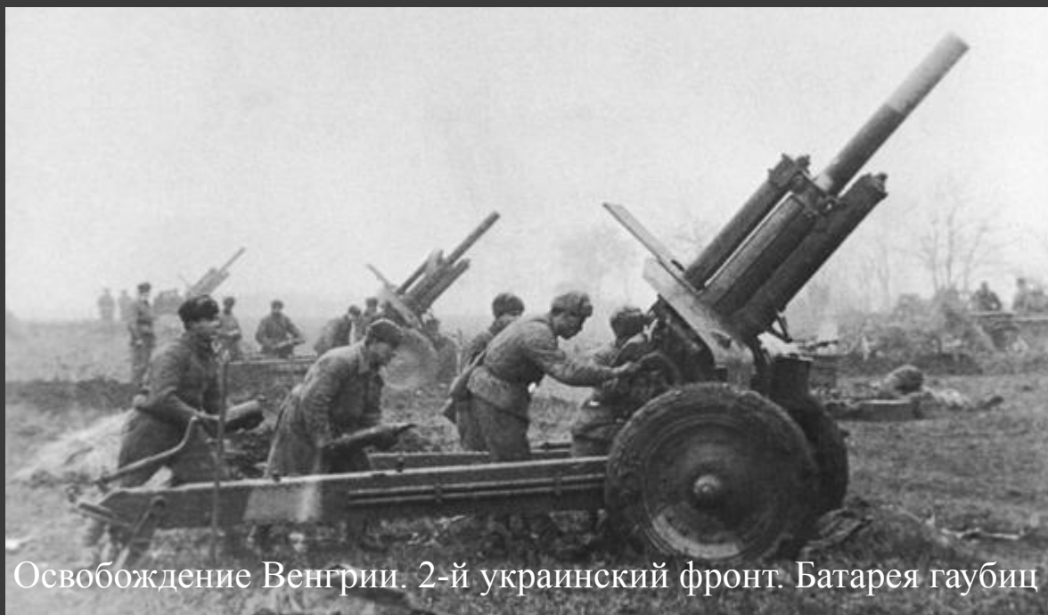
Освобождение Венгрии. 2-й украинский фронт. Батарея гаубиц

По рассказам прадедушки жестокие сражения шли и днем и ночью, часто не ослабевая по несколько суток. Немцы контратаками крупных сил танков, артиллерии и пехоты пытались отбросить наши войска, но все контратаки врага были отбиты с большими для него потерями.