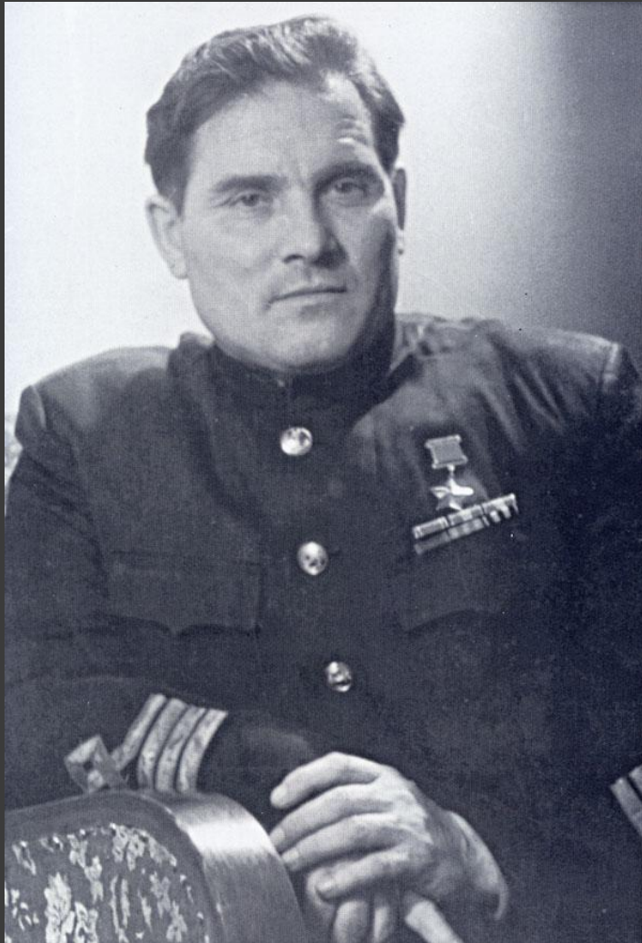
Девятаев Михаил Петрович Герой Советского Союза

В том же самом плену оказался и известный советский летчик Девятаев Михаил Петрович , с которым они встречались уже после Войны и вспоминали те страшные минуты, которые переживали вместе.