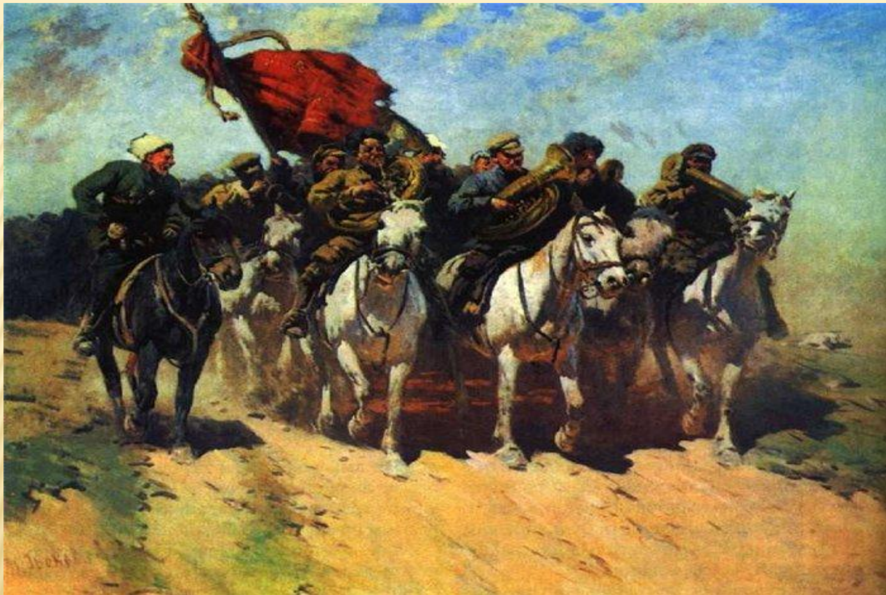
М. Греков «Трубачи первой конной армии»