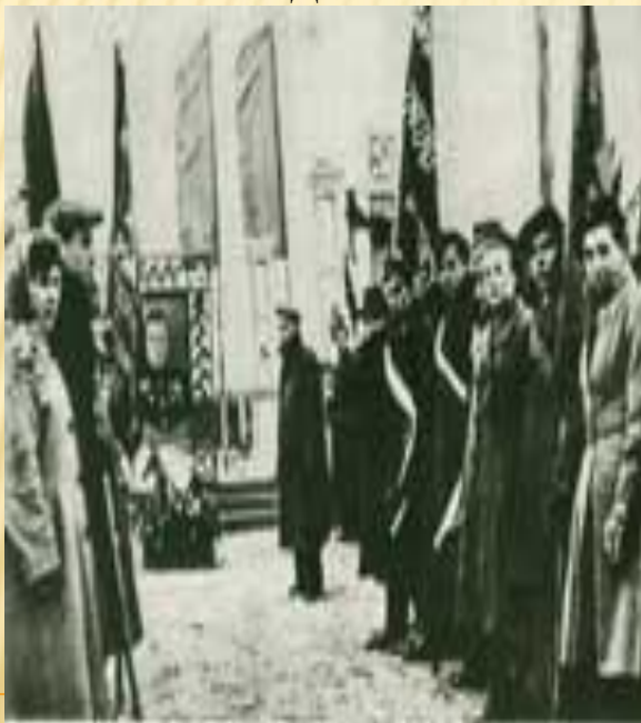
ОТКРЫТИЕ ОБЕЛИСКА НА МОГИЛЕ ИВАНА ТУРКЕНИЧА НА КЛАДБИЩЕ СОВЕТСКИХ ВОИНОВ В Г. ЖЕШУВЕ

В ЧЕСТЬ И. В. ТУРКЕНИЧА В ПОЛЬСКОМ ГОРОДЕ ЖЕШУВ НА КЛАДБИЩЕ СОВЕТСКИХ ВОИНОВ УСТАНОВЛЕН СЕМИМЕТРОВЫЙ ОБЕЛИСК, НА КОТОРОМ НА ПОЛЬСКОМ И РУССКОМ ЯЗЫКАХ ВЫСЕЧЕНЫ ЕГО ИМЯ И ФАМИЛИЯ.