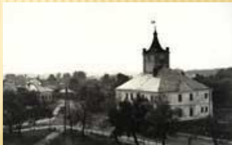
ЗДЕСЬ БЫЛ ПОХОРОНЕН ИВАН ТУРКЕНИЧ