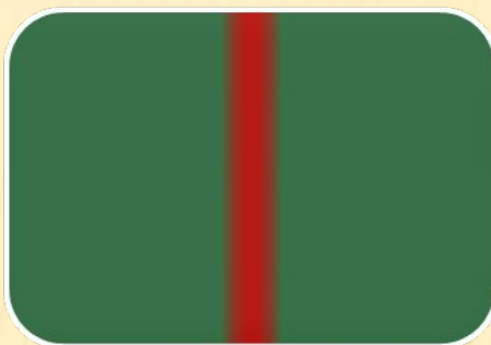
Медаль «Партизану Отечественной войны» I степени