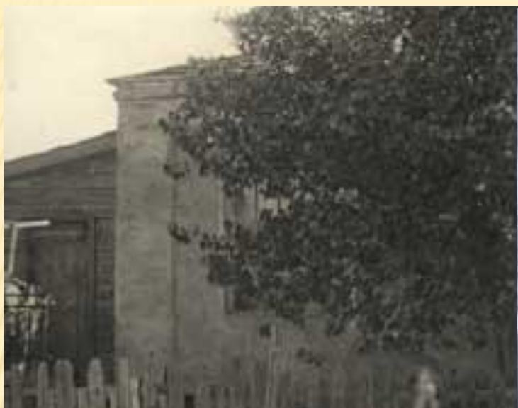
ДОМ ИВАНА ТУРКЕНИЧА