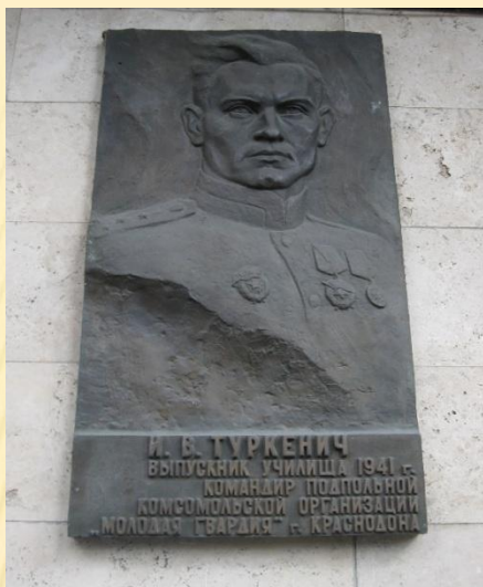
МЕМОРИАЛЬНАЯ ДОСКА ИВАНУ ТУРКЕНИЧУ