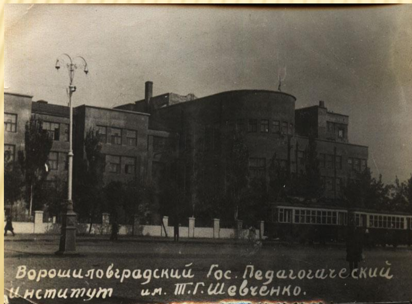
Ворошиловградский Гос. Педагогический институт и.м. П.Г.Шевченко.

Окончив 7 классов, поступил на РАБФАК ВОРОШИЛОВГРАДСКОГО ПЕДИНСТИТУТА, ОРГАНИЗОВАННЫЙ В ТЕ ГОДЫ В КРАСНОДОНЕ. В 1937 ГОДУ НАЧАЛ ТРУДОВУЮ ДЕЯТЕЛЬНОСТЬ В ТИПОГРАФИИ РАЙОННОЙ ГАЗЕТЫ "СОЦИАЛИСТИЧЕСКАЯ РОДИНА" НАБОРЩИКОМ-МЕТРАНПАЖЕМ. В МАРТЕ СЛЕДУЮЩЕГО ГОДА КОМСОМОЛЬСКАЯ ОРГАНИЗАЦИЯ РЕДАКЦИИ ГАЗЕТЫ ПРИНЯЛА ЕГО В ЧЛЕНЫ ВЛКСМ..