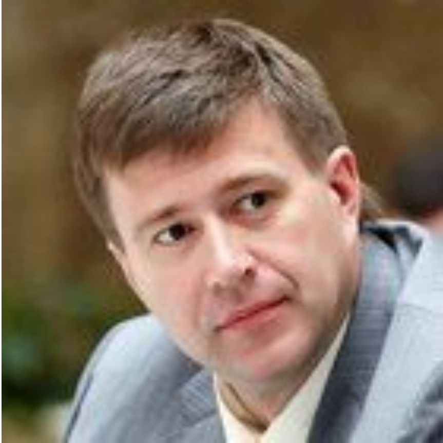
Коновалов Александр Владимирович Министр юстиции