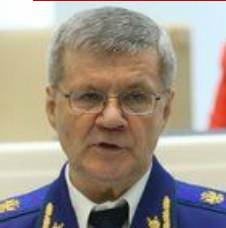
Чайка Юрий Яковлевич Генеральный прокурор