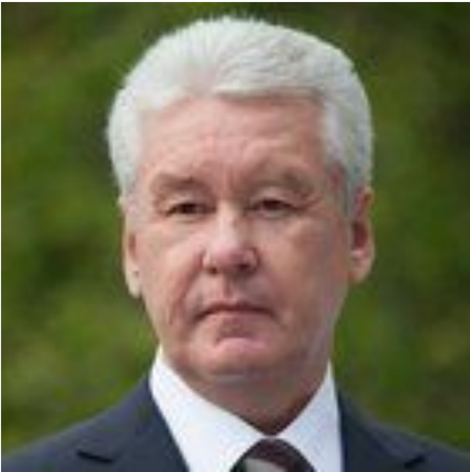
Собянин Сергей Семёнович мэр Москвы