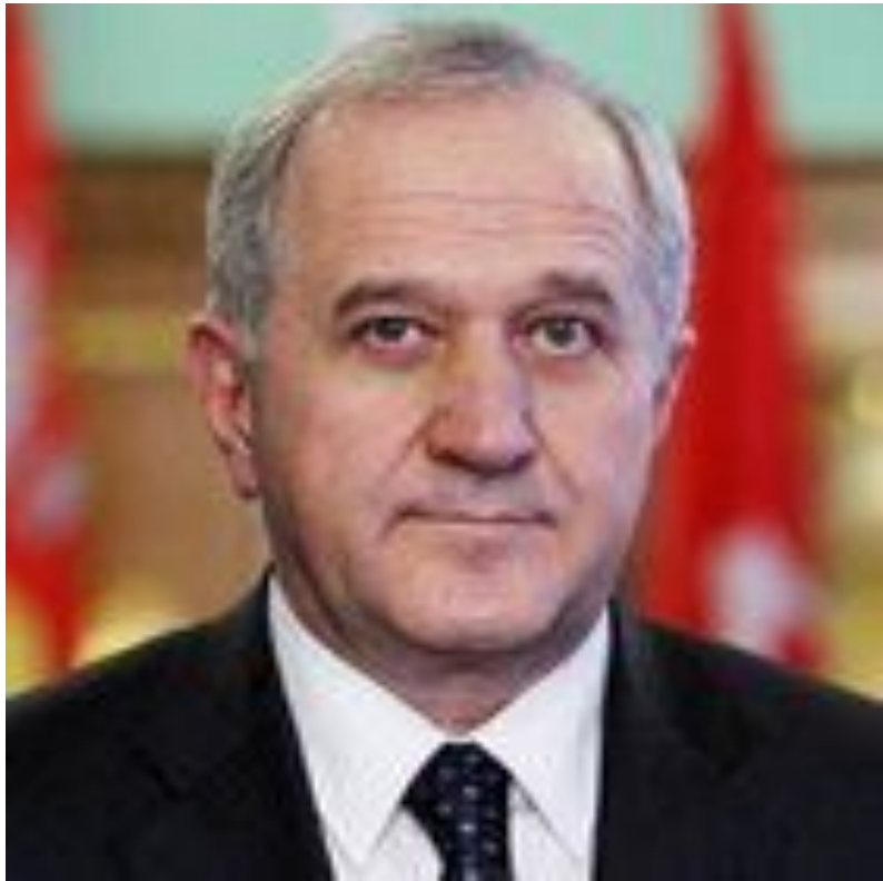
Булавин Владимир Иванович Руководитель Федеральной таможенной службы