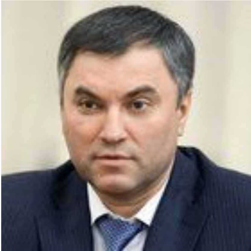
Володин Вячеслав Викторович Председатель Государственной Думы