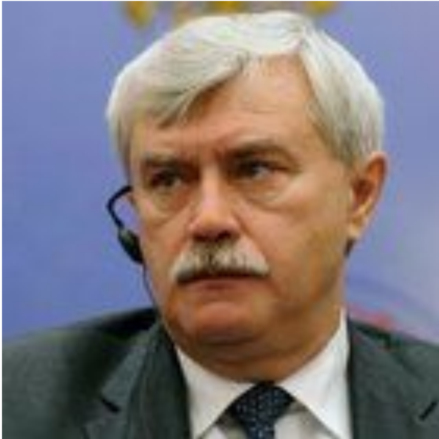
Полтавченко Георгий Сергеевич губернатор Санкт-Петербурга