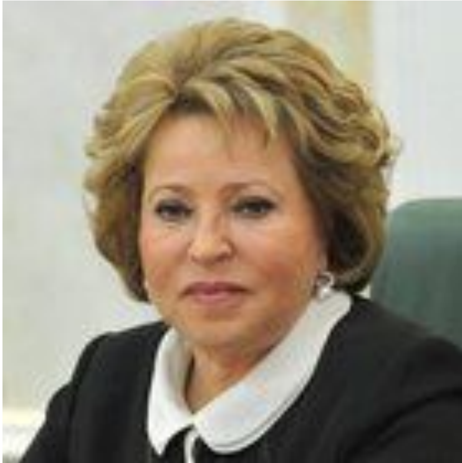
Матвиенко Валентина Ивановна Председатель Совета Федерации