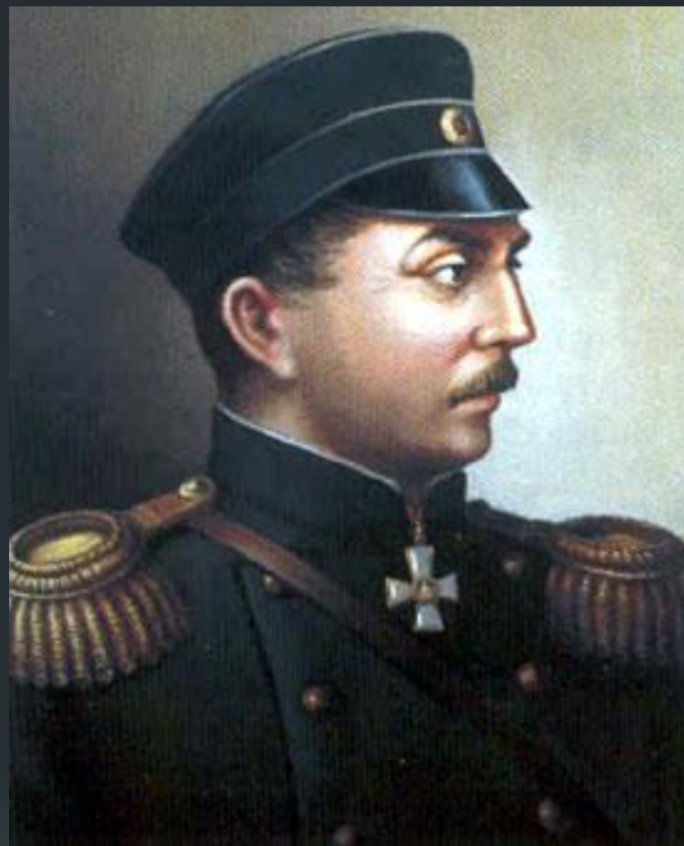
Павла Степановича Нахимова