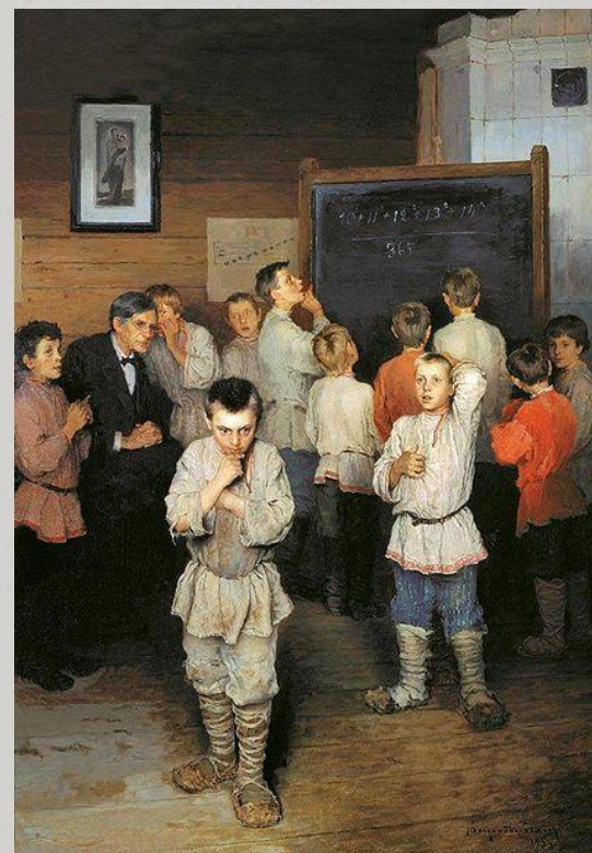
Н. Богданов-Бельский. «Устный счет в народной школе» 1896 г.