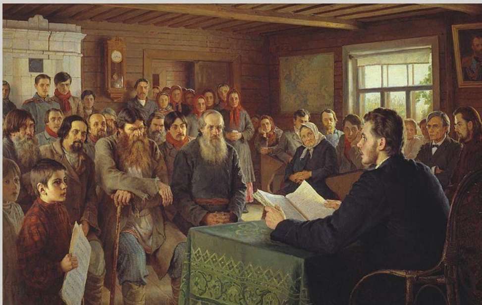
Н. Богданов-Бельский. Воскресное чтение в сельской школе. 1895 г.

«Чтобы быть хорошим преподавателем, нужно любить то, что преподаешь, и тех, кому преподаешь» В. О. Ключевский