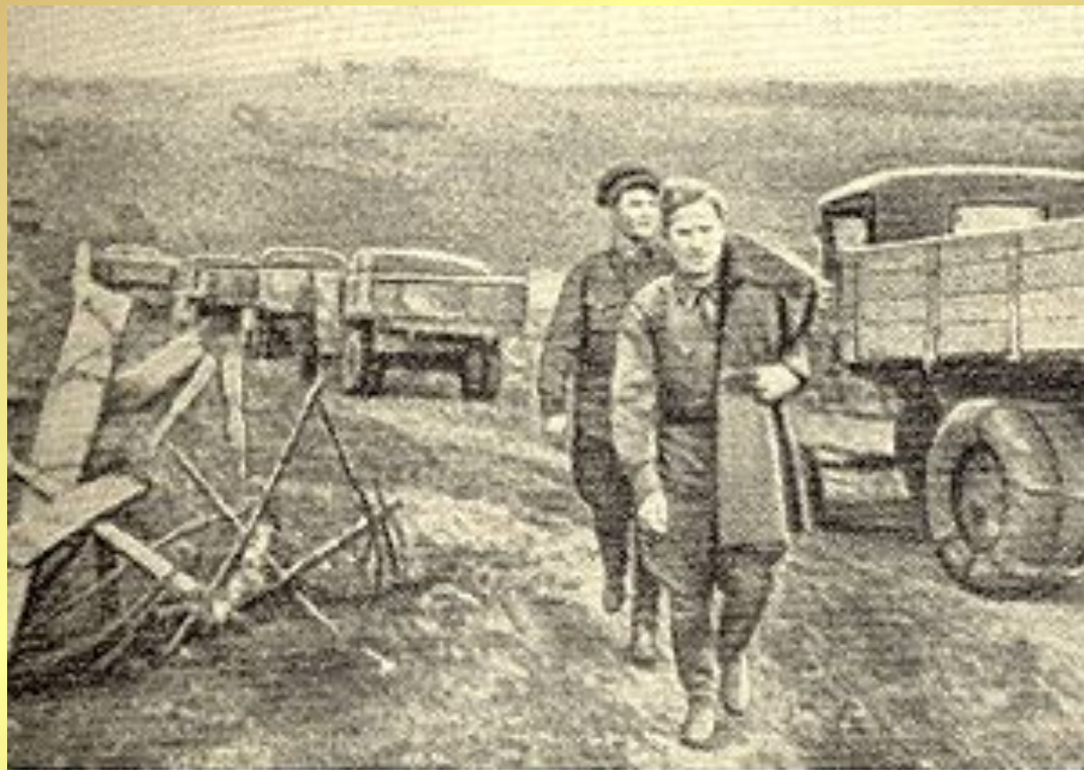
А.Сурков и К.Симонов на ржевском направлении