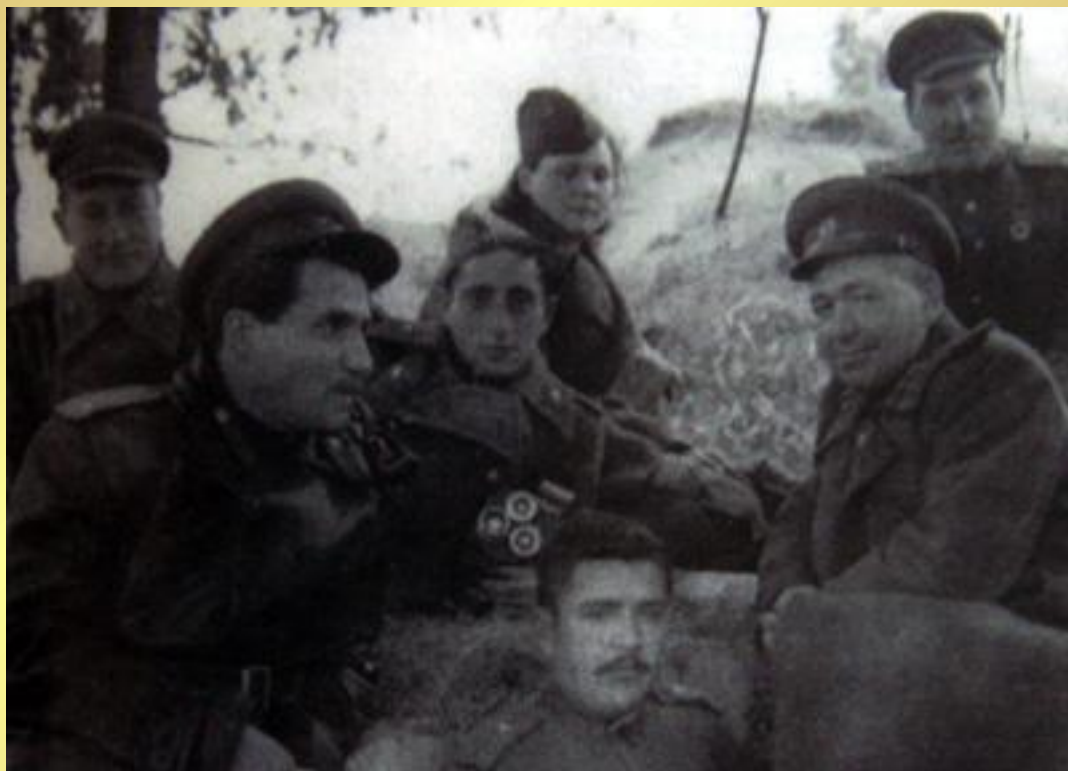
К.Симонов с солдатами 62 армии