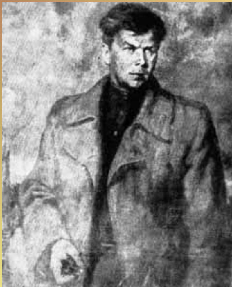
А. Твардовский, художник Вячеслав Смирнов