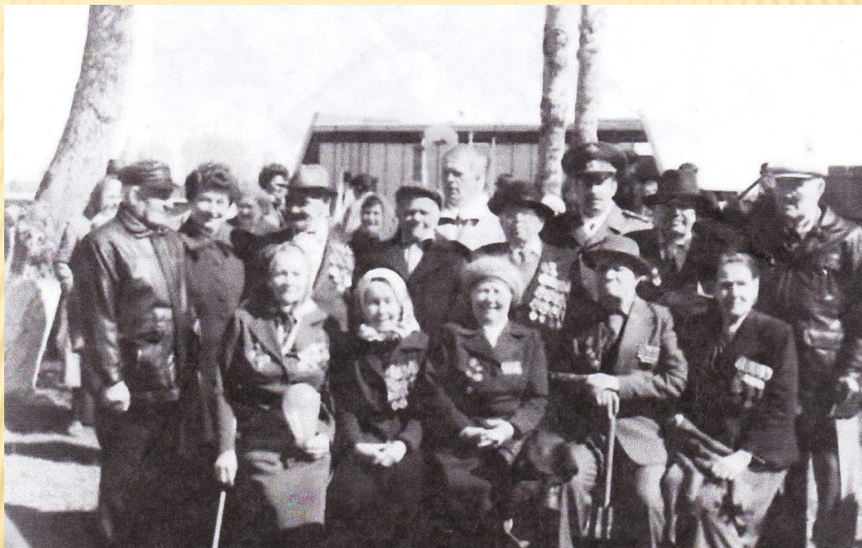
Ветераны Усть-Вымского района Республики Коми в День Победы. Село Айкино.