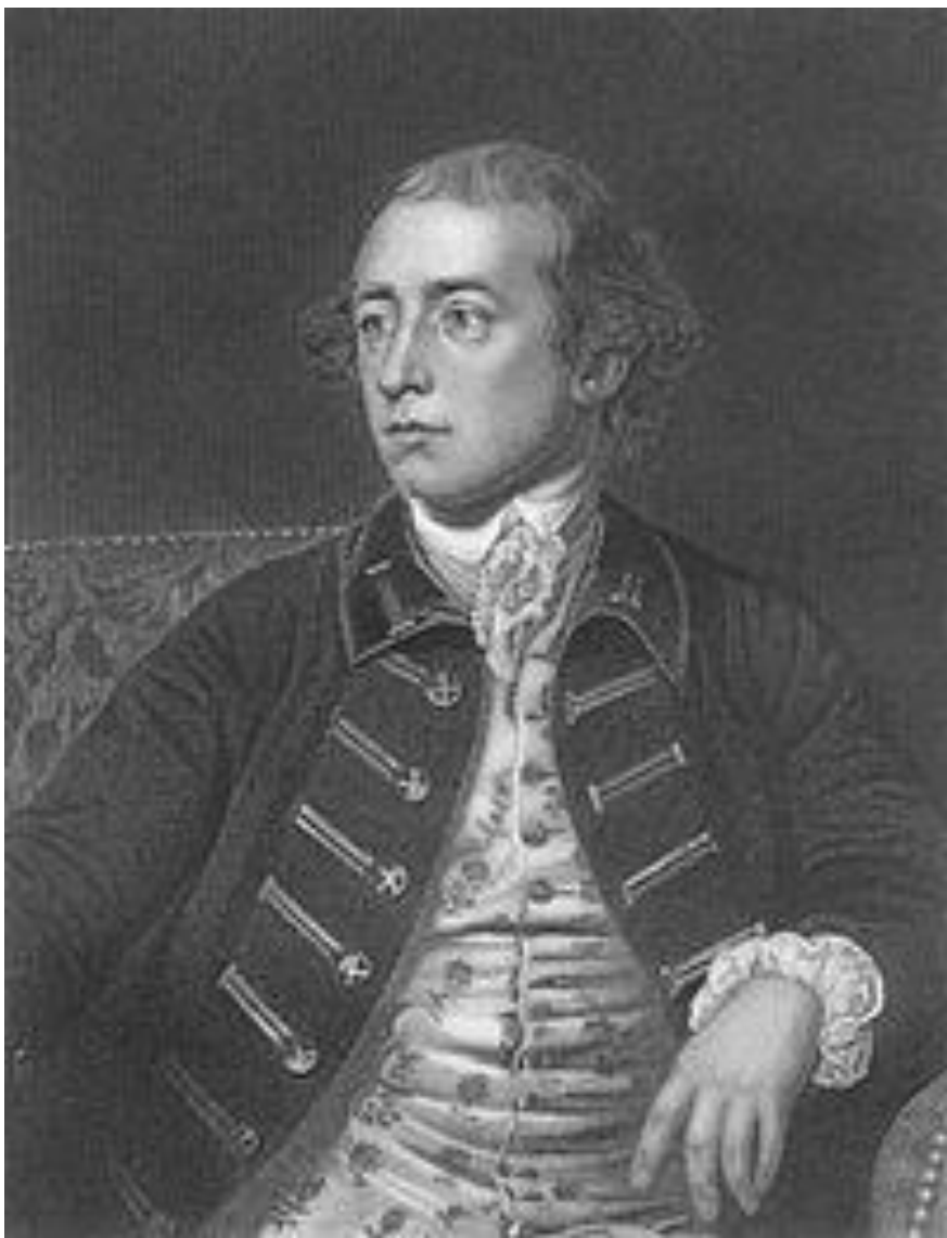
Уоррен Гастингс, 1774-1785 генерал- губернатор Индии