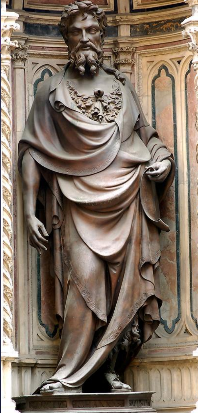
Л.Гиберти, статуя Иоанна Крестителя в церкви Орсанмикеле