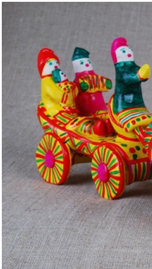
«Любота» — сц