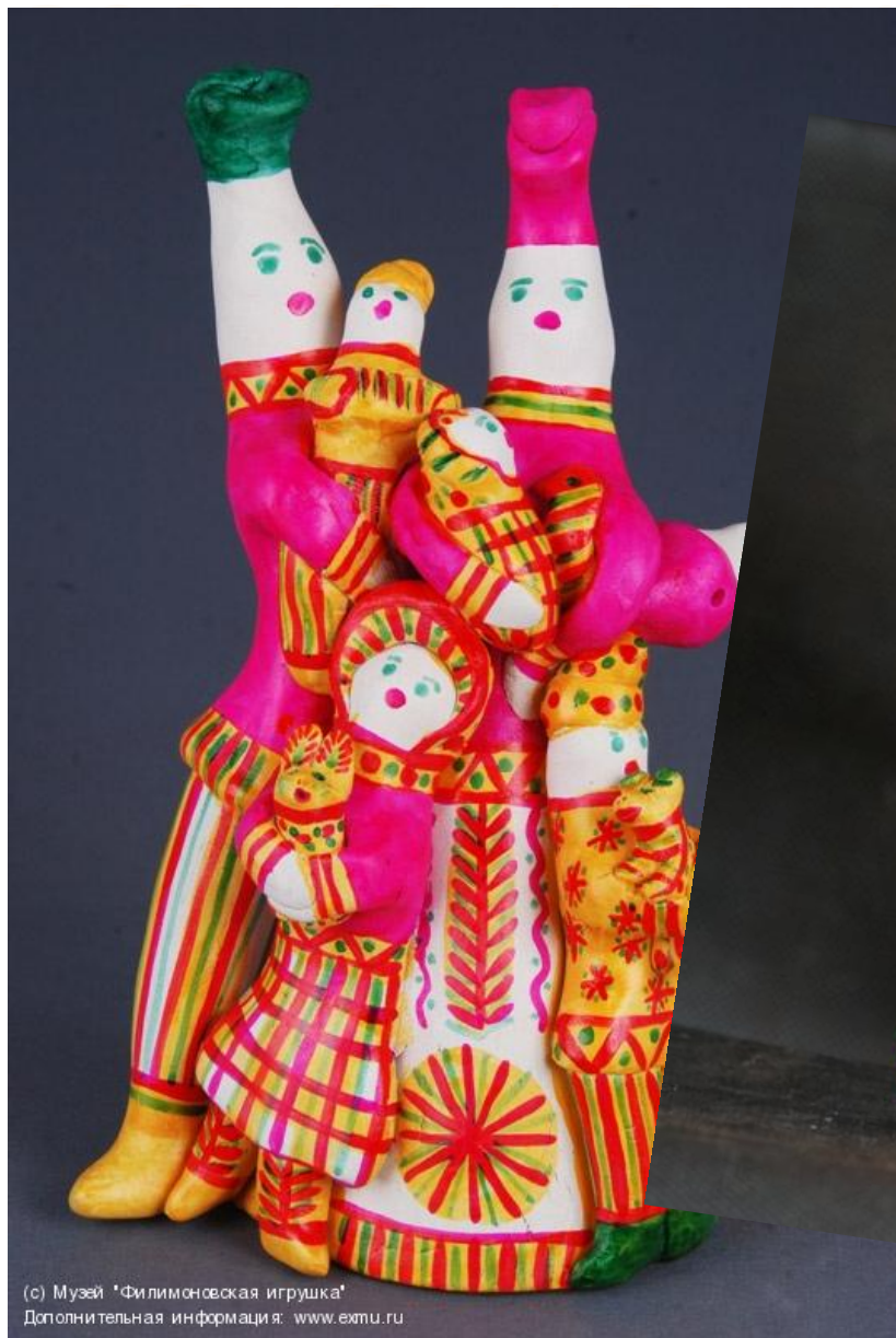
Дополнительная информация: www.ехтп.гу