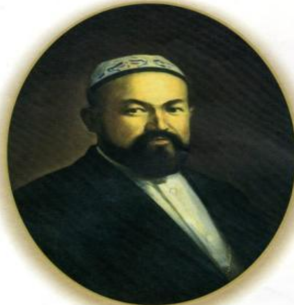
МУНАВВАР ҚОРИ (1878–1931)