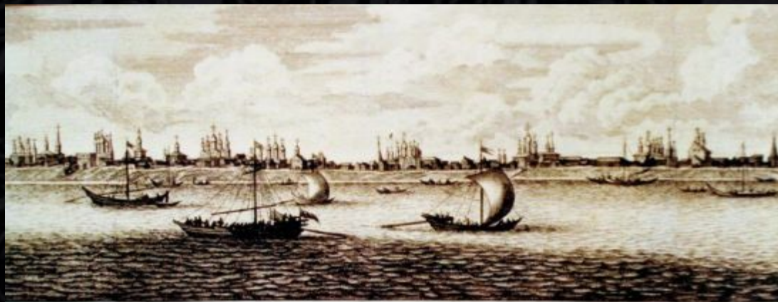
Азия. Суровых изъ еванг. Voyages en 1701-1708 de Corneille Le Bruin Amsterdam 1718 in fr.