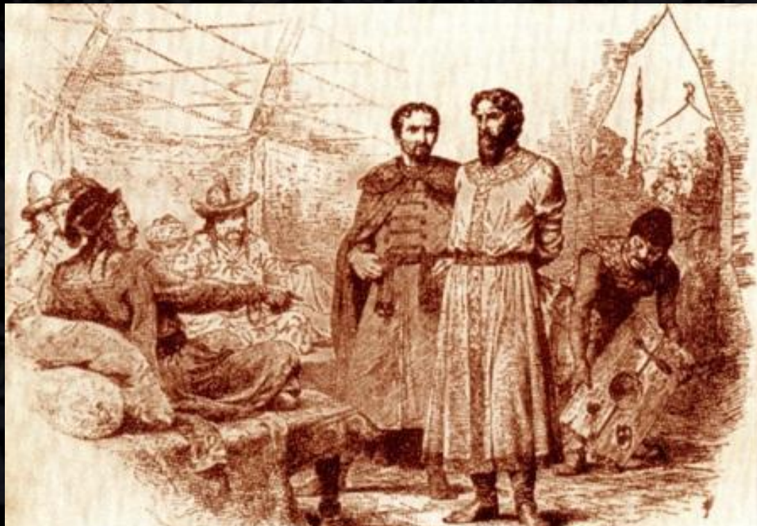
Хан Узбек принимает русского князя

Торговые пути стали не только безопасными, но и благоустроенными.