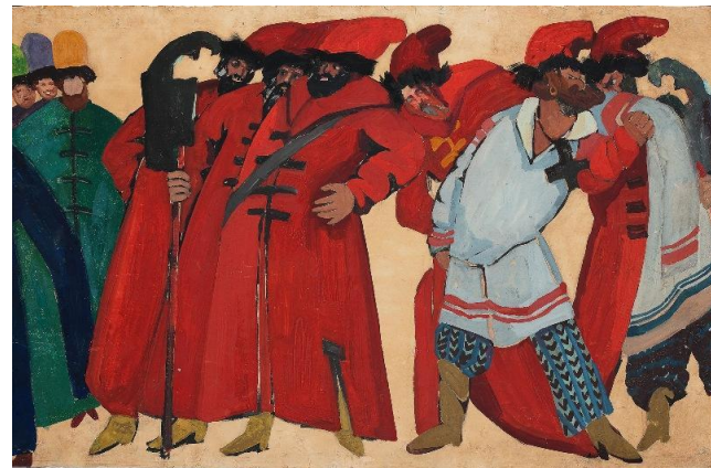
Эскизы мужских костюмов (Хованщина, 1913)

Русский и советский театральный декоратор, вместе с Головиным создавший советскую школу театральной декорации. Соединяет модерн мирискусников и авангард более позднего художественного течения. Эскизы крупные, написанные широко.