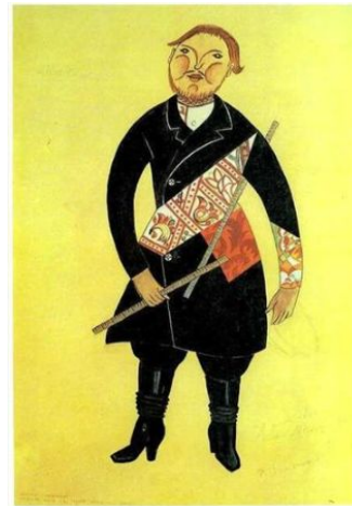
Эскиз костюма купца (Шут, 1921)