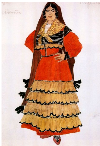
Эскиз костюма Кармен (Кармен, 1908)