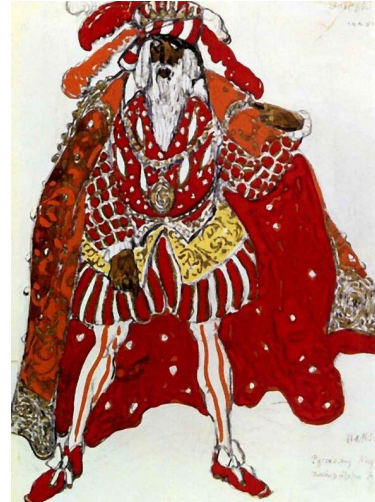
Эскиз костюма придворного (Легедна об Иосифе, 1914)