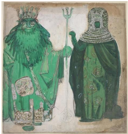
Эскиз костюмов Морского Царя и Царицы (Садко, 1911)