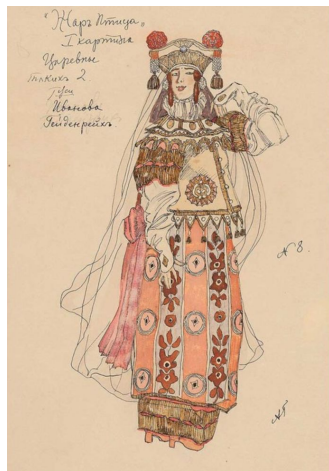
Эскиз костюма пленённой царевны (Жар-Птица, 1910)