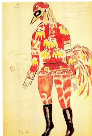
Эскиз костюма Петуха (Лисица, 1915)