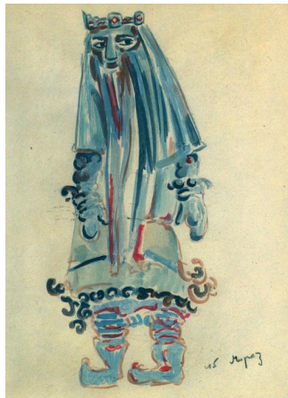
Эскиз костюма Мороза (Снегурочка, 1912)