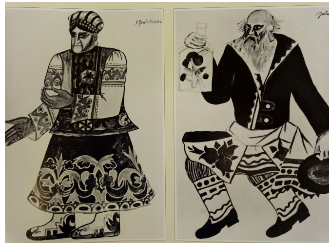
Эскиз костюмов старика и старухи (Золотой Петушок, 1914)

Художник уже следующего, авангардного поколения. Привносит в театральную декорацию лубочную упрощённость, плоскостность, народную простоту. Ориентируется на иконные и народные образы. Изменяет пластический характер эскизов: вместо изящных образов создаёт подчеркнито рубленые, топорные модели, похожие на деревянные игрушки.