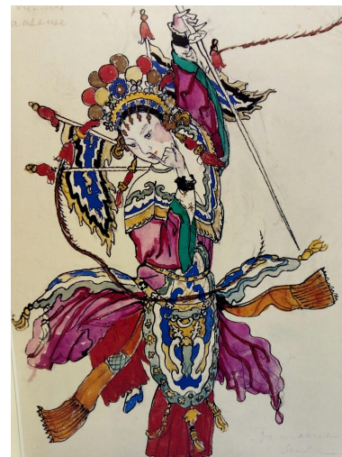
Эскиз костюма главной танцовщицы (Соловей, 1914)