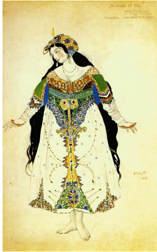
Эскиз костюма Царевны (Жар-Птица, 1910)