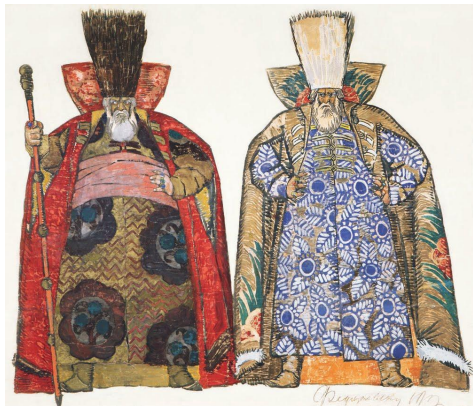
Эскиз 2 костюмов Ивана Хованского (Хованщина, 1913)