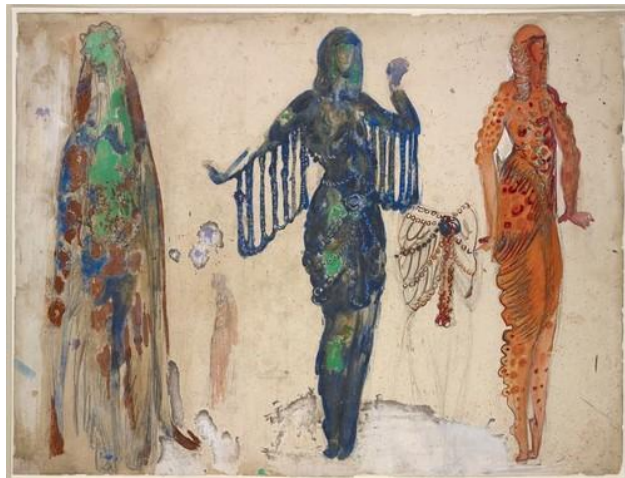
Эскиз костюмов морских обитателей (Садко, 1911)