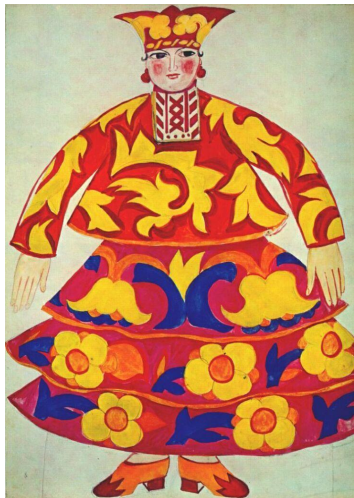
Эскиз костюма Девушки (Золотой Петушок, 1914)