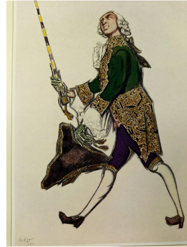
Эскиз мужского костюма (Весёлые женщины, 1917)

Звезда дягилевской антрепризы, Л. С. Бакст поднял искусство театрального декоратора на один уровень с композиторским и хореографическим, превратив декорации (в частности костюмы и эскизы костюмов) в самостоятельные произведения искусства. Первым начал практиковать создание костюмов для конкретных исполнителей. Первым в эскизах стал использовать сложные танцевальные позы, чтобы показать костюм как пластический атрибут представления.