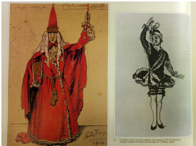
Эскизы костюмов Красного Мага и Пажа (Павильон Армиды, 1909)