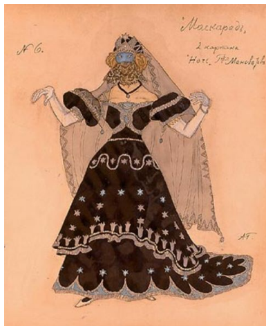
Эскиз костюма Ночи (Маскарад, 1911)