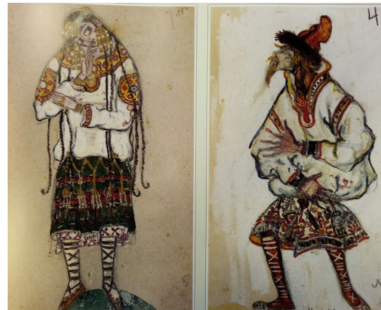
Эскиз костюмов девушки и старика (Весна Священная, 1913)

Больше всего интересуется национально-романтическими образами славянской древности. Стремится привнести в искусство языческий примитивизм. Создаёт костюмы, пластическая форма которых подчёркивает особенности движений танца: изломанность, резкость («Весна Священная»). Работал вместе с хореографом, чтобы добиться единства художественного образа.