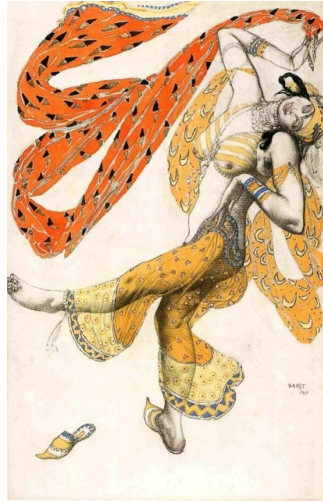
Эскиз костюма танцовщицы (Шахерезада, 1910)