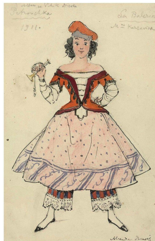
Эскиз костюма танцовщицы (Петрушка, 1911)