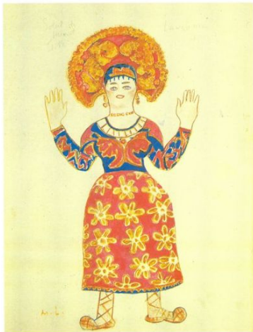
Эскиз костюма женщины (Полуночное солнце, 1915)