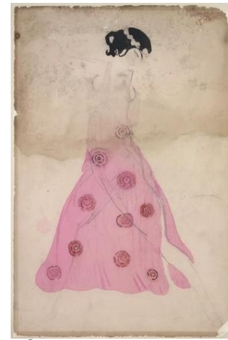
Эскиз костюма танцовщицы (Клеопатра, 1916)

Русский, а затем американский театральный декоратор, член «Мира Искусства». В ранних работах — очень оригинален, стремится как бы «развоплотить» свои модели. Фигуры тонкие, растительно-волнистые, обобщённые. Мало внимания уделяет «практической» стороне эскизов (в отличие от Головина и Бакста, прописывавших декор вплоть до пуговиц).