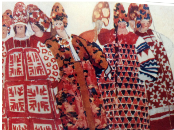
Эскизы женских костюмов (Хованщина, 1913)