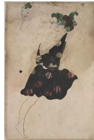
Эскиз костюма танцовщицы (Клеопатра, 1916)