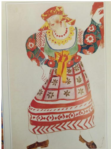
Эскиз костюма сенной девушки (Золотой Петушок, 1914)