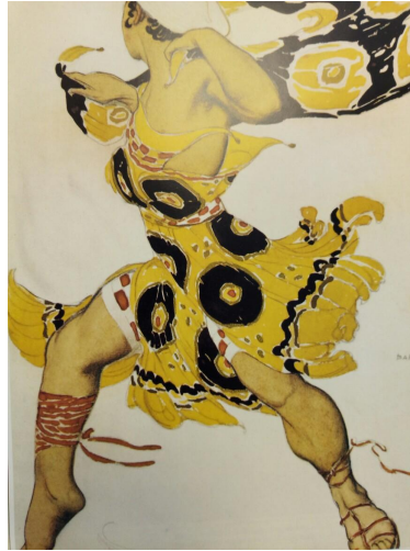
Эскиз костюма беготийца (Нарцисс, 1911)