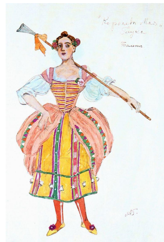
Эскиз костюма пастушки (Королева мая, 1919)