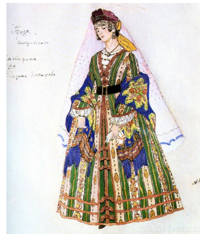
Эскиз костюма Катерины (Гроза, 1916)

Стремился привнести в традиционное и «ремесленное» дело театральной декорации впечатляющую визуальность, чтобы декоративное убранство спектаклей стало такой же важной частью впечатлений от театра, как и таланты исполнителей. Работал с Большим, Александринским, Новым, Эрмитажным и Мариинским театром.