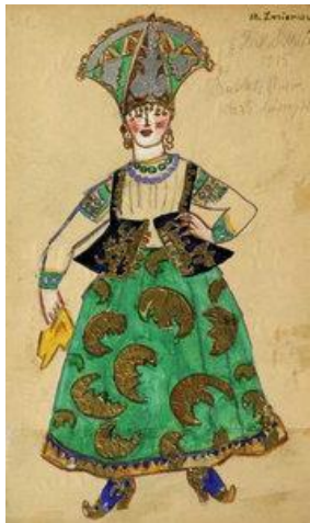
Эскиз костюма женщины (Полуночное солнце, 1915)