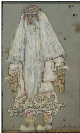
Эскиз костюма Мороза (Снегурочка, 1912)