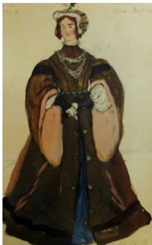
Эскиз костюма дамы (Жизель, 1909)