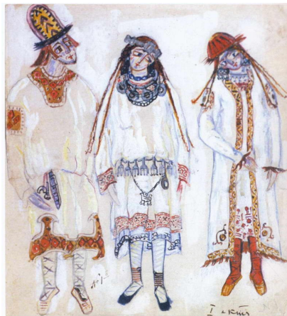
Эскиз костюмов девушек и парня (Весна Священная, 1913)