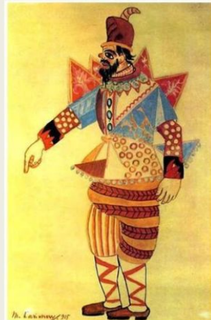
Эскиз костюма мужчины (Шут, 1921)

Воплощает синтез искусств в авангарде: в дягилевской антрепризе занимался костюмами, сценографией, активно помогал создавать образы, работал как консультант с хореографией. В сценографии и эскизах костюмов использовал найденные им методы «лучизма» («Полуночное солнце», «Лисица»). По сравнению с Гончаровой, более склонен к мелким, дробящимся формам, геометризации.