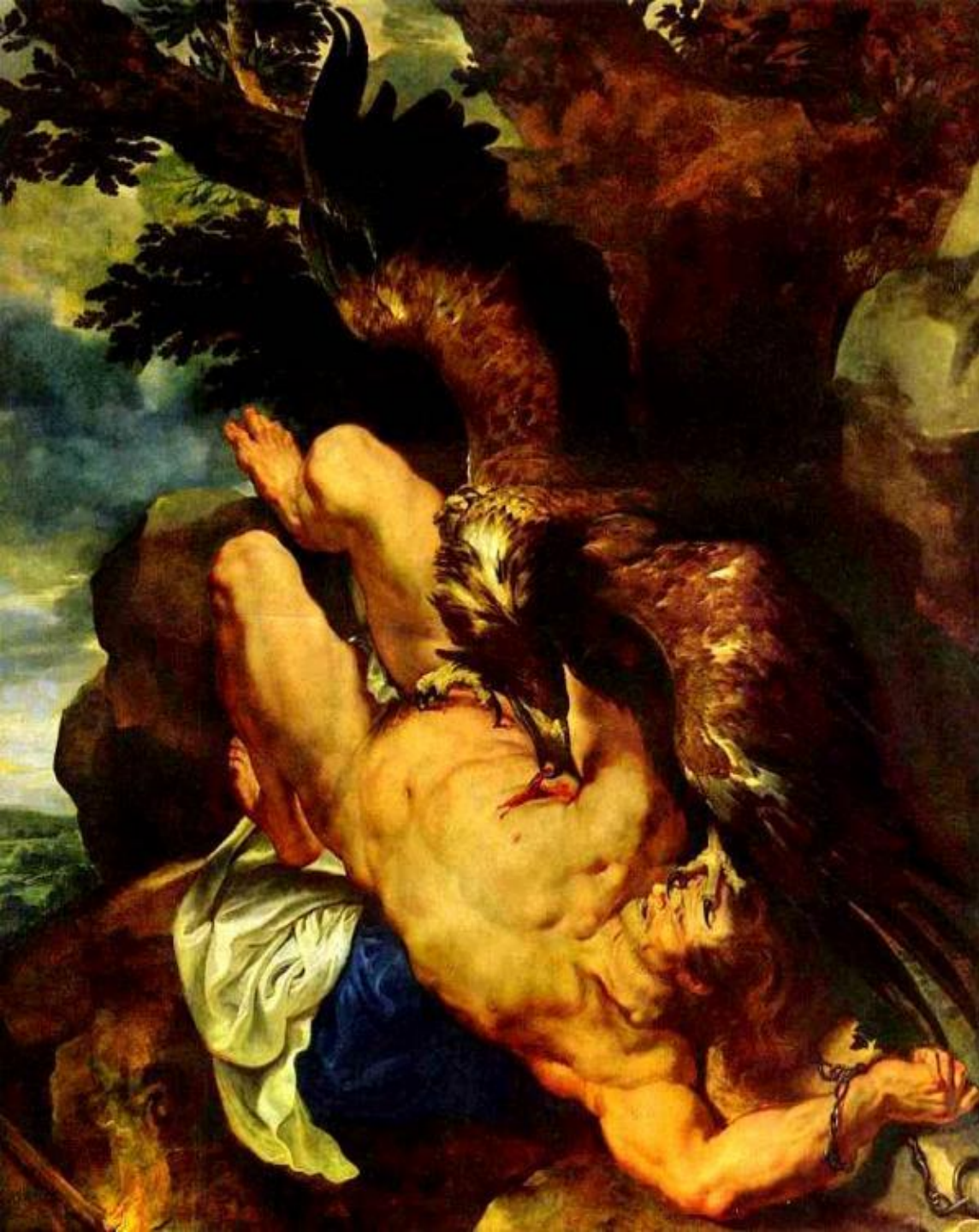
П.П.Рубенс. «Прометей прикованный».