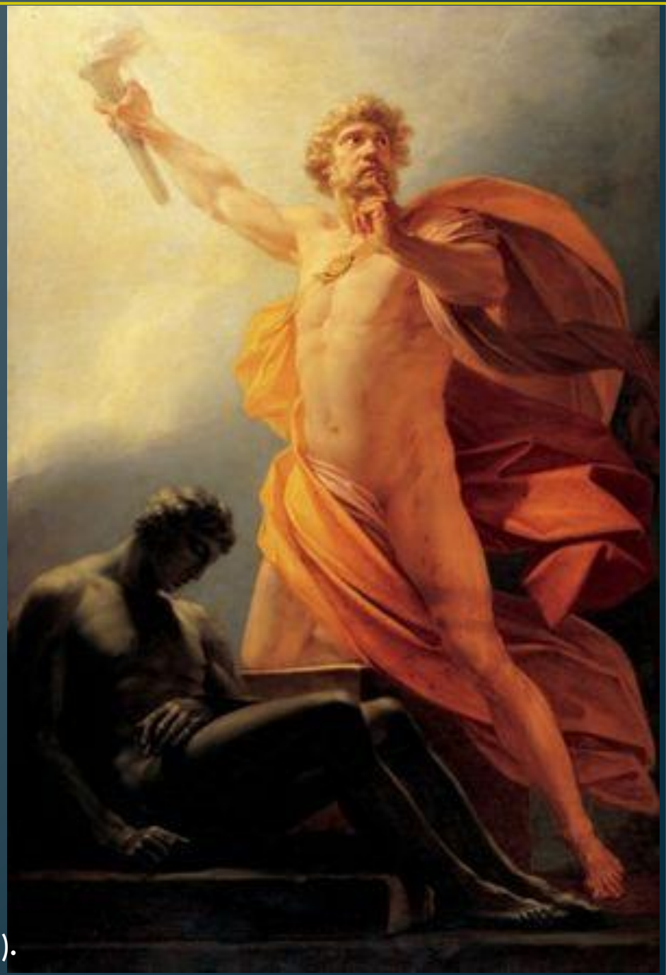
Генрих Фридрих Фюгер. «Прометей несёт людям огонь». (1817 г.).