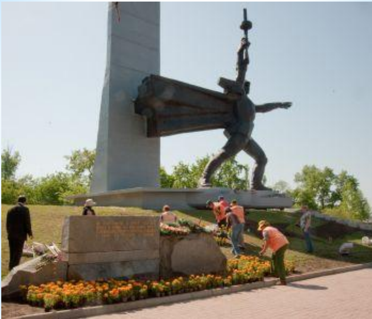
Воинам, форсировавшим Днепр на месте, с которого началось форсирование Днепра войсками 6 Армии 3-го Украинского фронта в ноябре 1943. Авторы – скульптор Б. Раппопорт, архитектор Ю. Егоров.