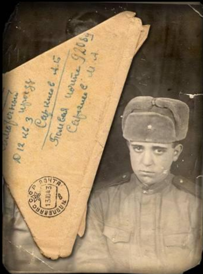
Письмо с фронта