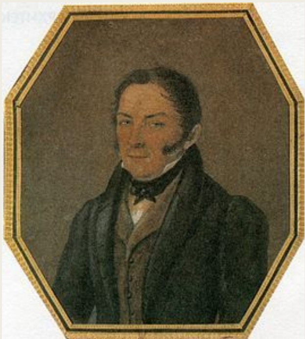
О. И. Бове