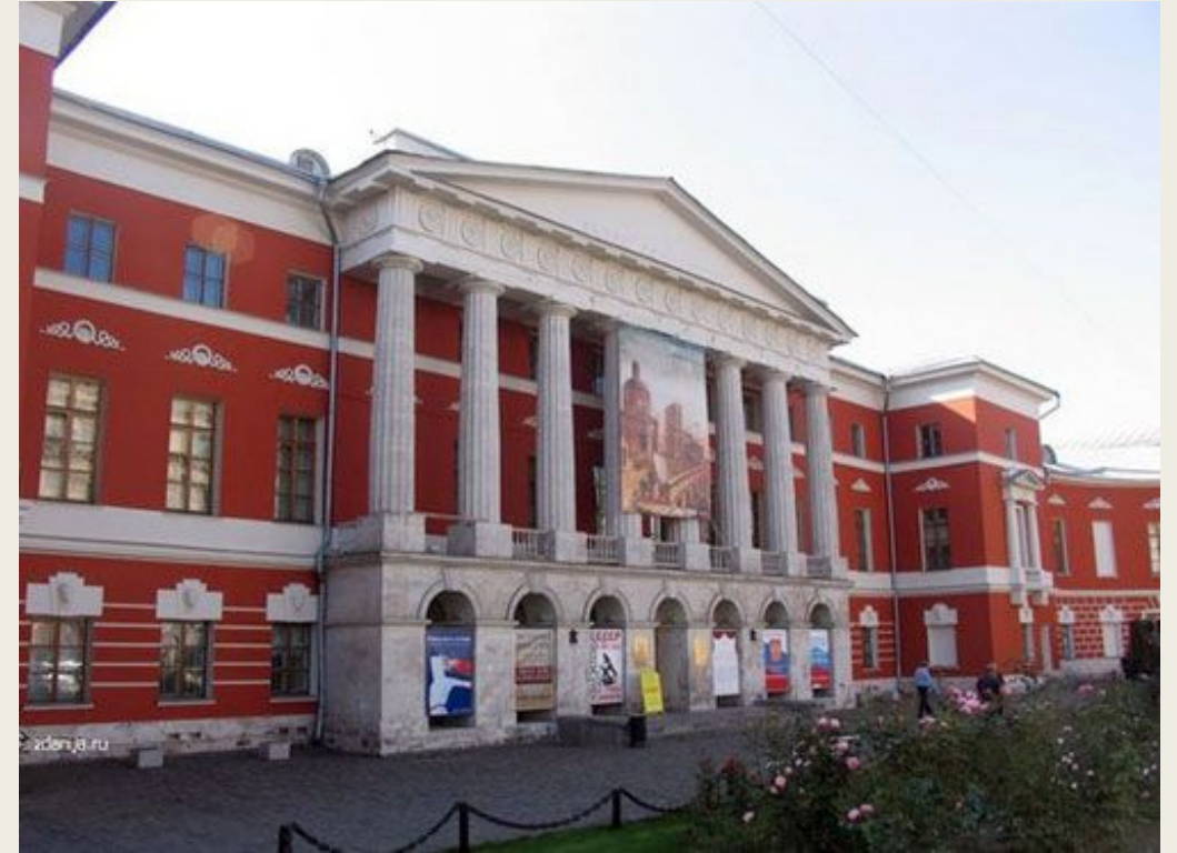
Государственный центральный музей современн ой истории России