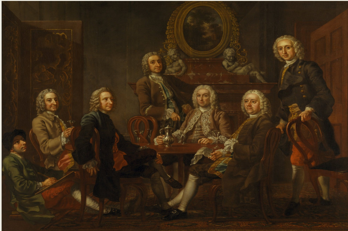
Первые джентльменские клубы в Англии