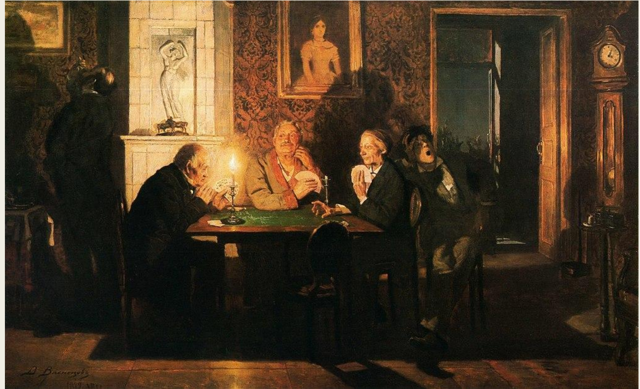
«Преферанс» - Виктор Васнецов