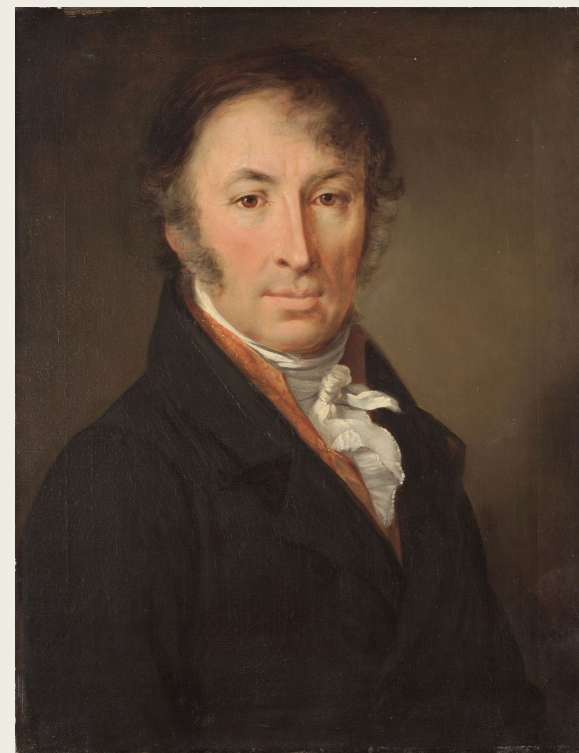
Н. М. Карамзин