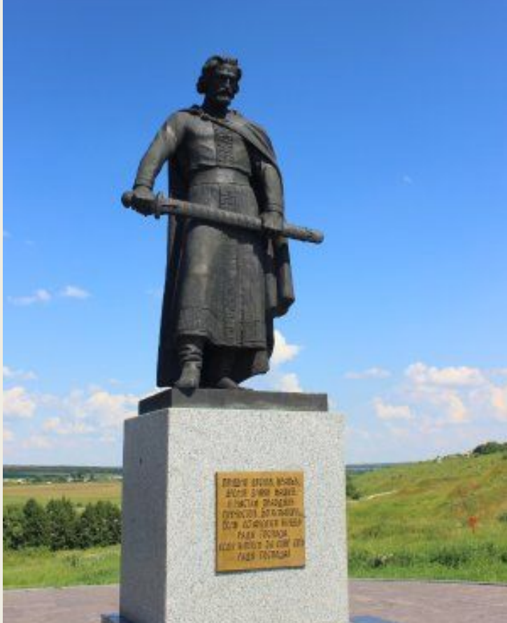
Памятник Дмитрию Донскому на Куликовом поле