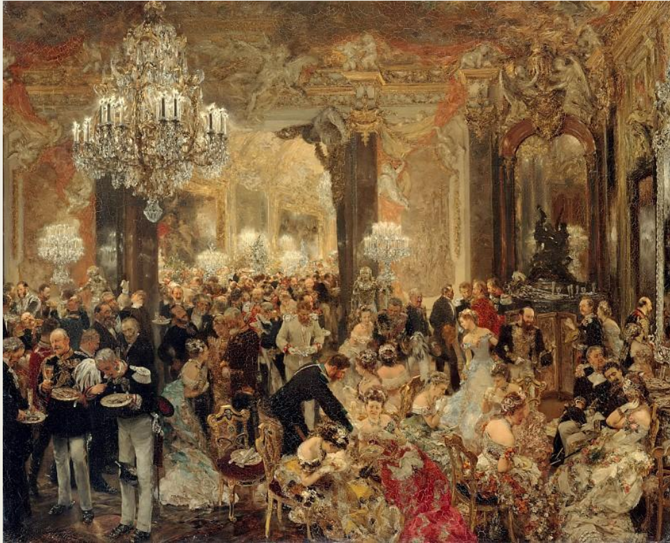
«Ужин на балу» – Адольф фон Менцель