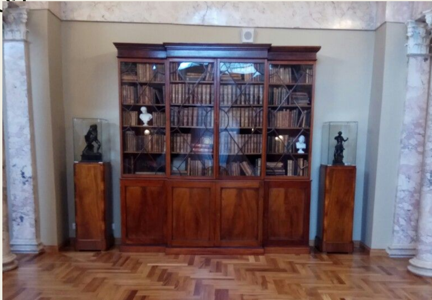
Один из книжных шкафов из библиотеки клуба.