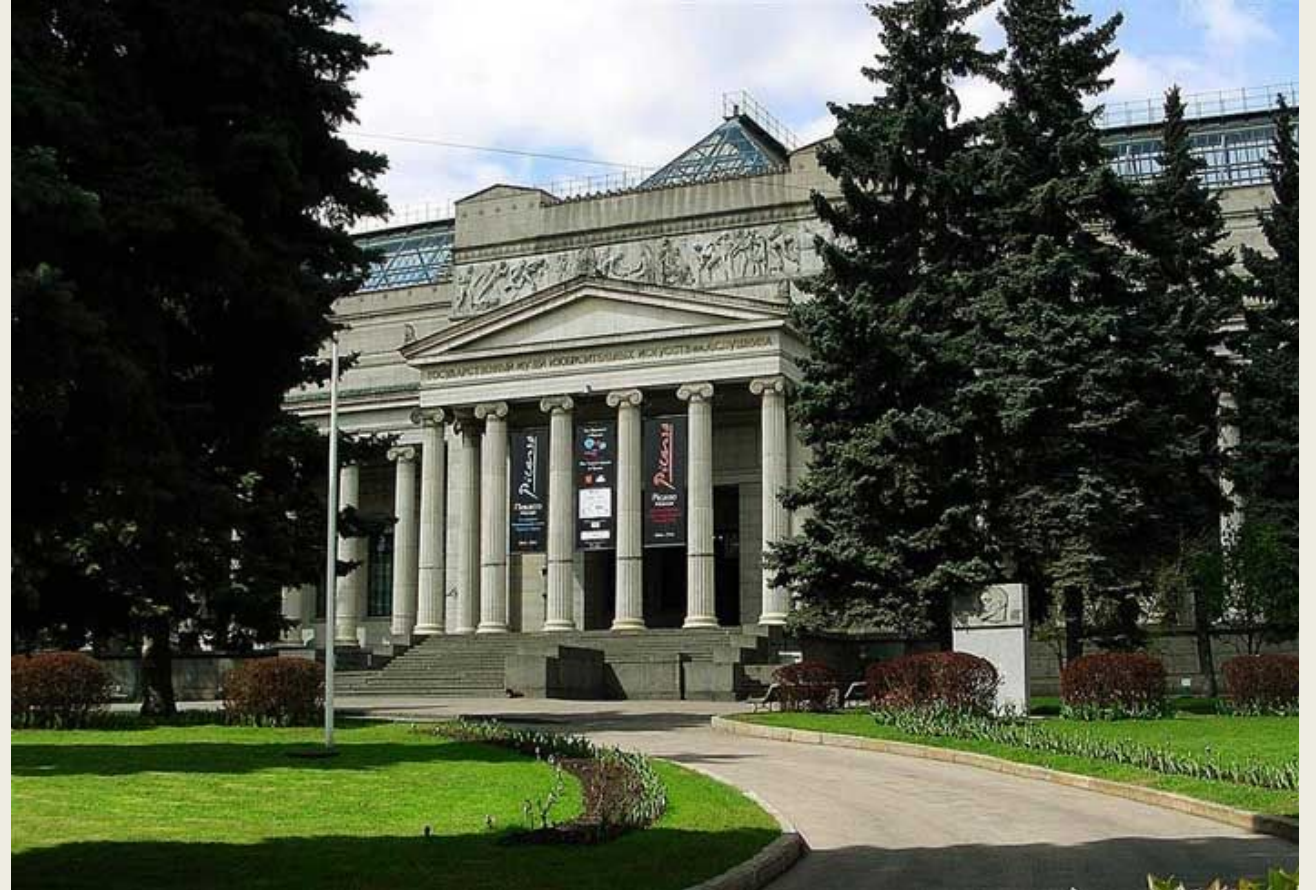
Государственный музей изобразительных искусств имени А.С. Пушкина