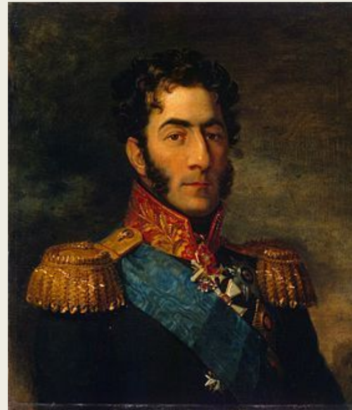
П. И. Багратион