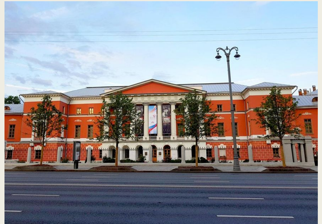
Здание Московского Английского клуба