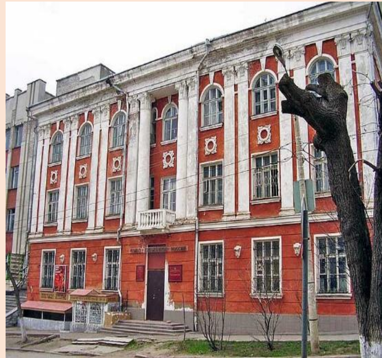
Россия, Киров, Ленинский район, улица Свободы, 67