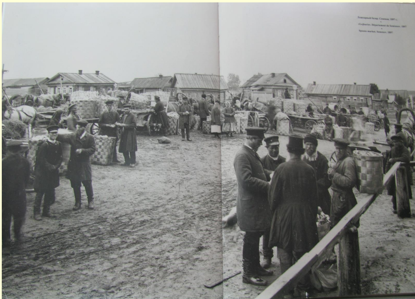
Фотография из фотоальбома М.Дмитриева «В фокусе времени»