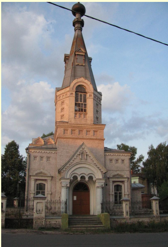
Вход в старообрядческую церковь