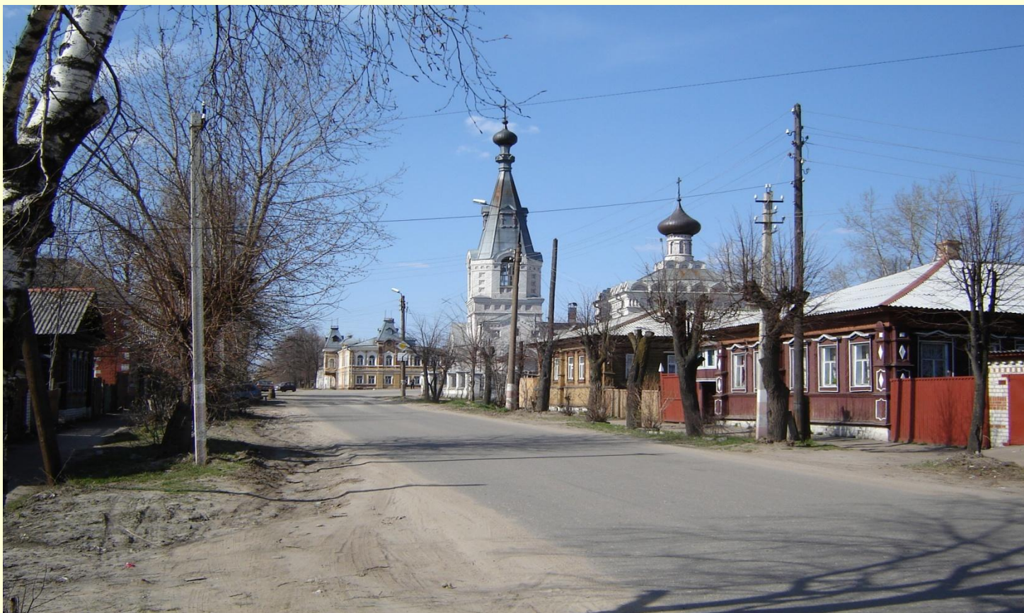
Бывшая Санохтинская улица

В городе сохранилось много интересных старинных зданий и архитектурных сооружений, представляющих историческую ценность.