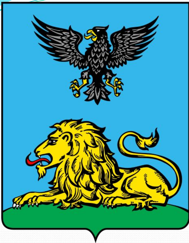
Герб Белгородской области