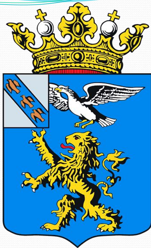
Герб уездного центра