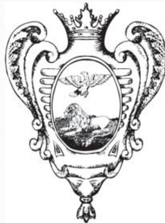
Герб губернского города Белгорода 1730 г.

● 1766 год. В Белгороде случился крупнейший пожар, который уничтожил почти 600 дворов, и в 1768 году был утвержден новый план застройки. Однако, выполнен он был лишь наполовину. Одним из условий этой масштабной застройки было строительство каменных домов только в центре города, а на окраинах – домов на каменных фундаментах.