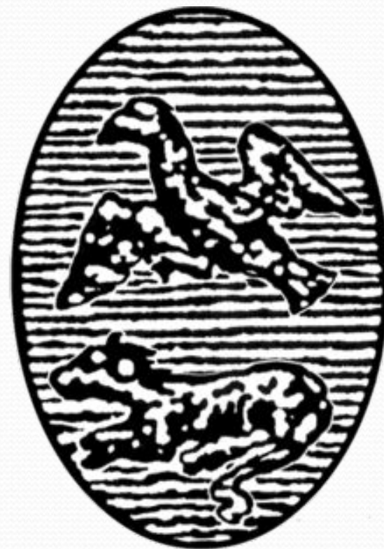
Рисунок герба Белгородской губернии с карты XVIII века.

XVIII век. Белгород становится одним из уездных городов Курской губернии. Развиваются кузнечное, кожевенное, бондарное ремесла и сапожное дело. Устанавливались и упрочнялись торговые отношения более чем с сорока городами. Продавали товары, созданные ремесленниками Белгорода, а также хлебом и солью. Из других городов в Белгород привозили железо, скот и галантерейные товары.