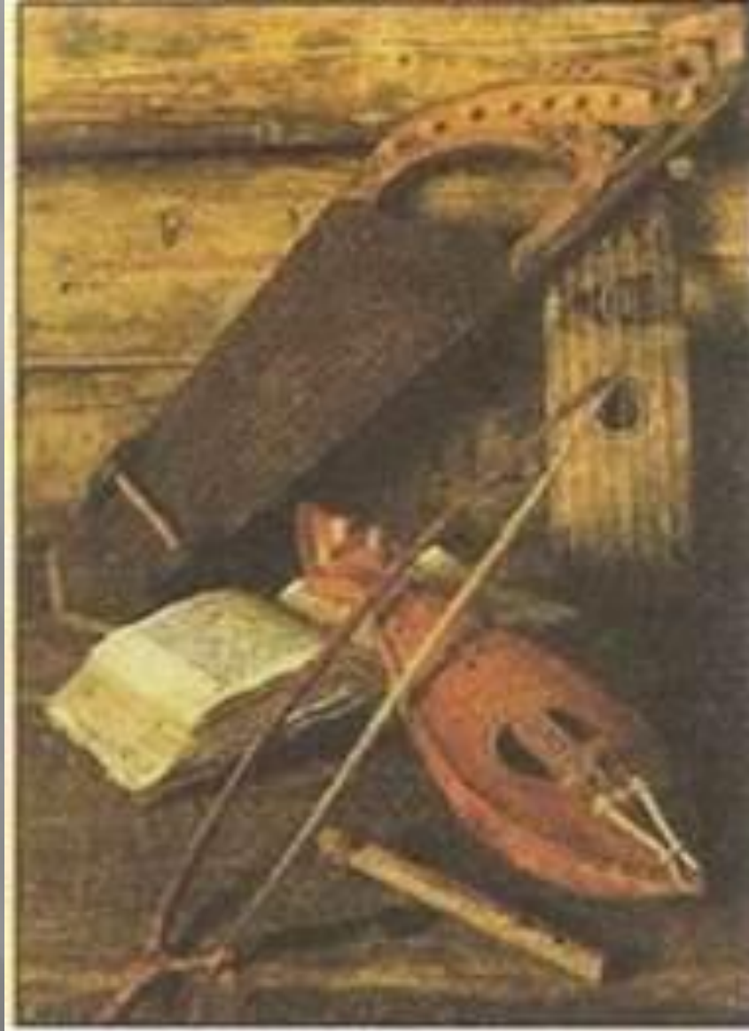
Музичні інструменти часів Київської Русі.