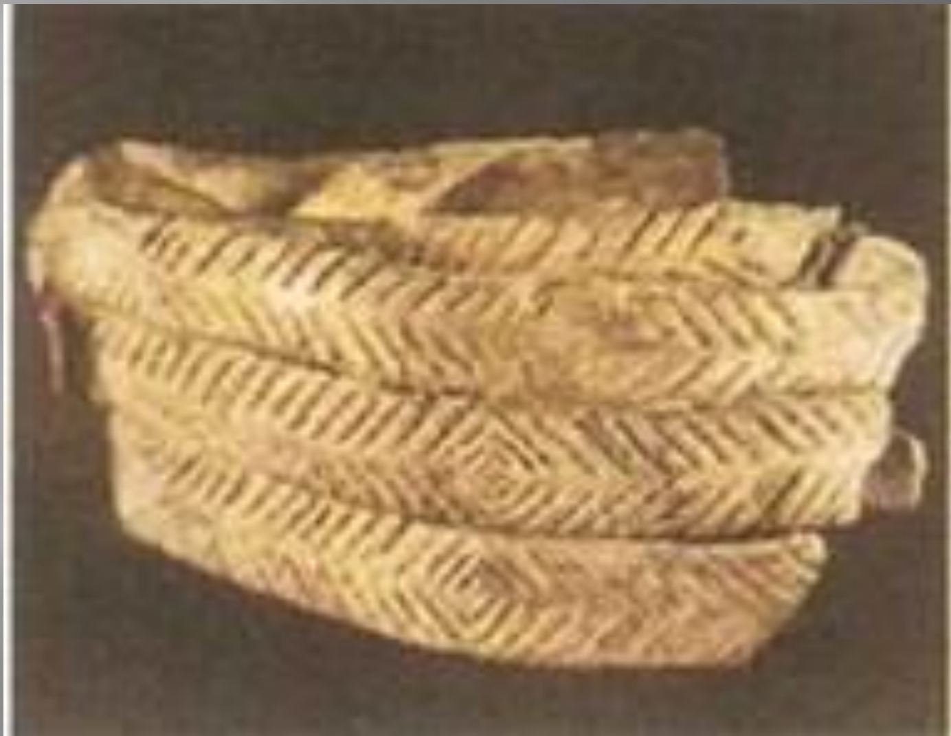
Шумовий браслет із кістки мамонта