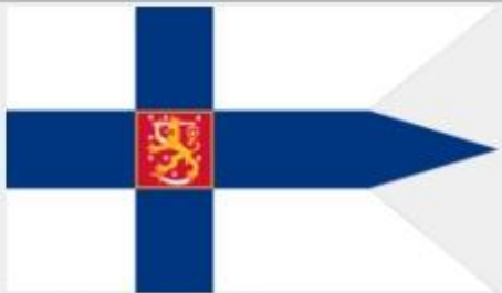
Государственный флаг с «косицами»