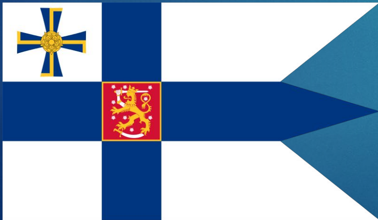
Флаг президента Финляндии

Президент республики использует государственный флаг с «косицами» с жёлто-белым Крестом Свободы в верхнем левом прямоугольнике.