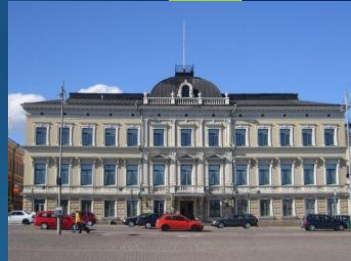
Здание Верховного суда Финляндии в Хельсинки

Граждане Финляндии, как и подобает гражданам цивилизованных стран, всегда уверены в том, что когда правда на их стороне, система правосудия это всегда установит!