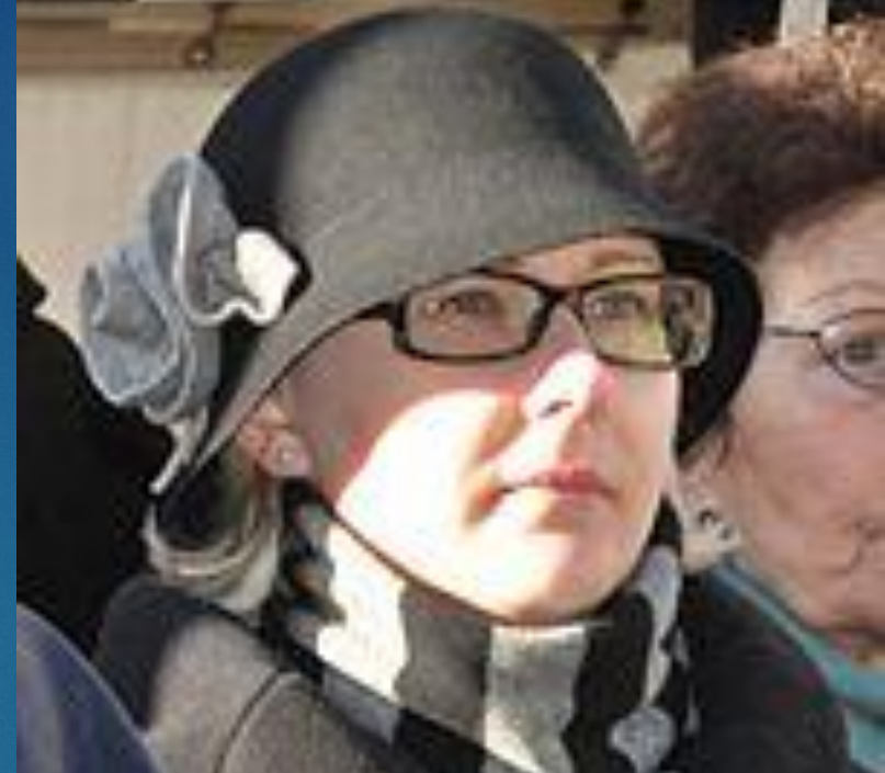
Мария Лохела, председатель эдускунты с 29 мая 2015

После победы на парламентских выборах 2015 года партии Финляндский центр 28 апреля 2015 года новым спикером парламента был избран председатель этой партии Юха Сипиля, на должность председателя финского парламента депутатами была утверждена кандидатура Марии Лохелы из партии Истинные финны.