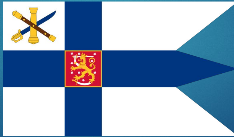
Флаг командующего Вооруженными Силами