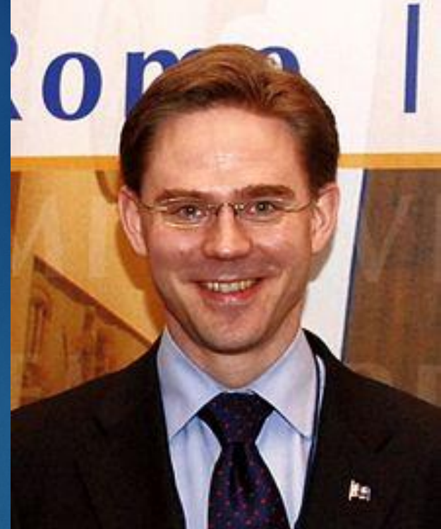
Юрки Катайнен, председатель Национальной коалиционной партии, победившей на последних парламентских выборах

В 1809 году в городе Борго (сейчас — Порвоо) состоялось сословное собрание (сейм), на котором собрались представители всех сословий Финляндии. Боргоский сейм традиционно считается началом отсчёта политической истории Финляндии. На нём была утверждена широкая автономия Великого княжества Финляндского, связанного с Российским императорским домом личной унией. Сейм фактически признал Великое княжество Финляндское национальным государством финского народа, до этого находившегося в зависимости от шведской короны, при этом сохранив преимущественное положение шведской элиты в Финляндии.