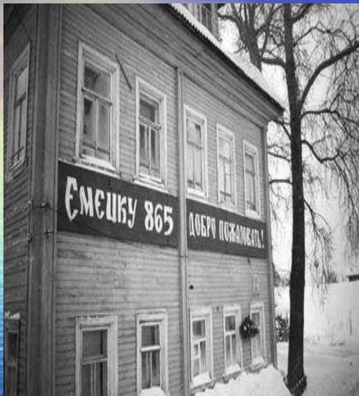
Дом в с. Емецк Архангельской области, где в 1936 г. родился Николай Рубцов

В последние детдомовские годы и годы, проведенные в техникуме, Рубцов словно бы и забыл, что у него есть отец. Никому из его знакомых тех лет не запомнилось, чтобы он пытался восстановить связь с отцом, братом, сестрой, теткой... Быть может, только однажды и попытался рассказать Николай «все накопившееся на душе за эти долгие годы бесконечного молчания». Случилось это уже в 1951 году, когда Рубцов писал сочинение на заданную в техникуме тему: «Мой родной уголок».