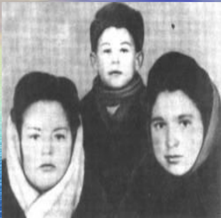
Николай Рубцов с воспитательницами детдома