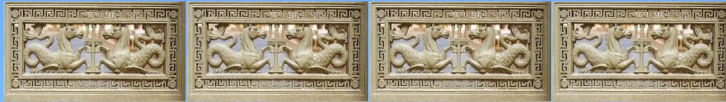
Орнамент, украшающий Аничков мост

Переносную симметрию в г. Санкт – Петербурге можно увидеть в орнаментах или решетках, которые используются для украшения мостов и оград.