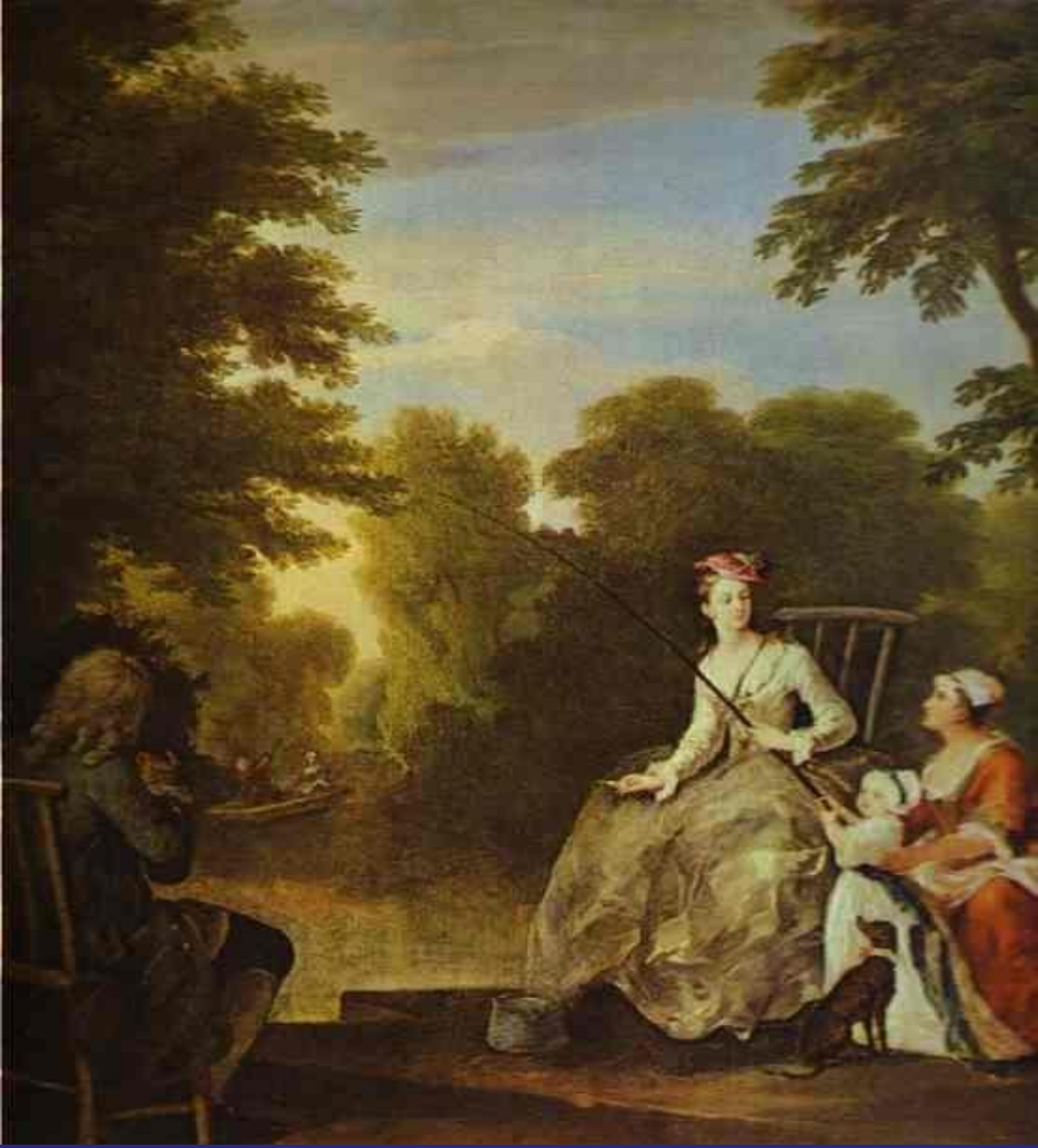
The fishing party