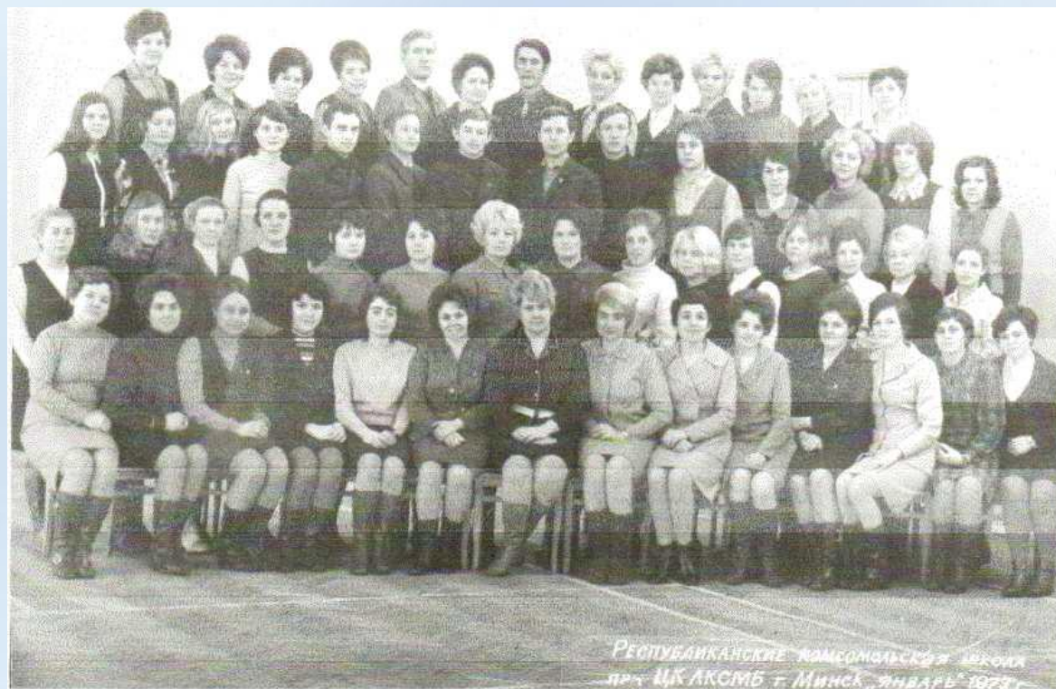
Республиканская комсомольская школа при ЦК ЛКСМБ г. Минск Январь 1973 г.