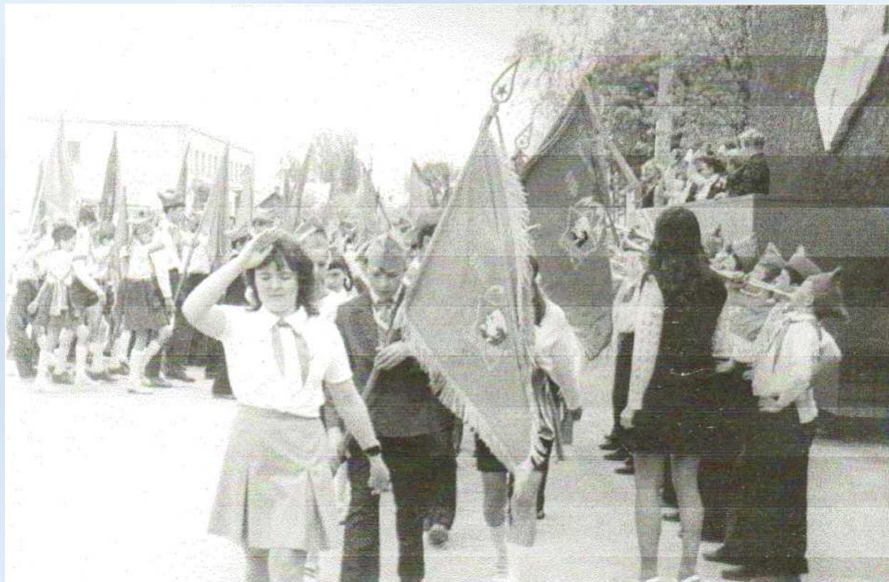
Митинг, посвящённый Дню рождения пионерской организации