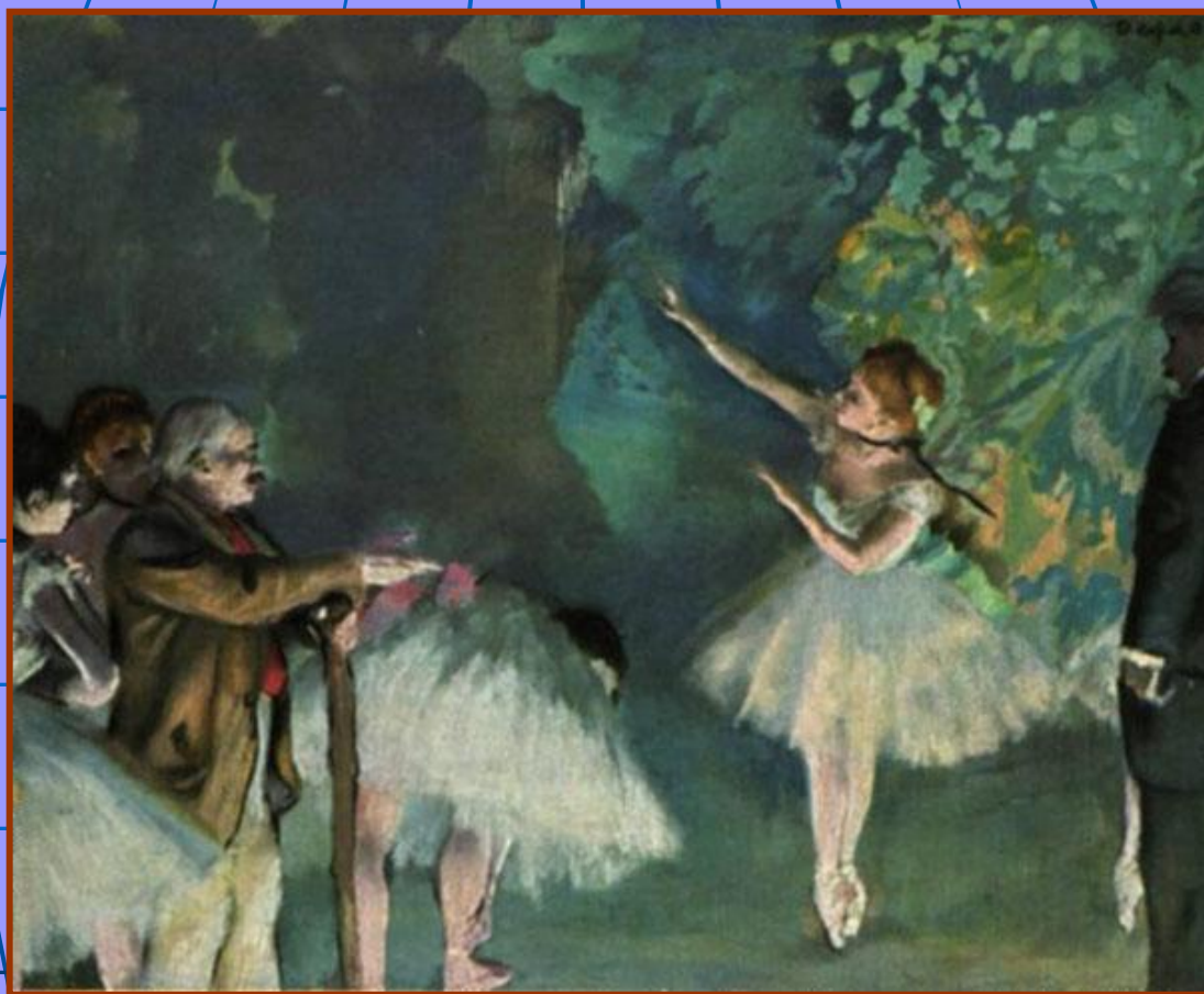
Эдгар Дега «Репетиция балета»