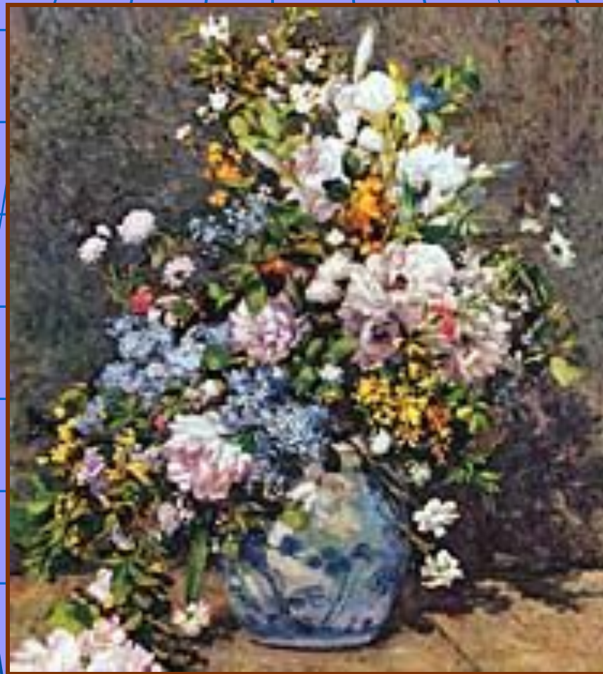
Огюст Ренуар «Большая ваза с цветами»