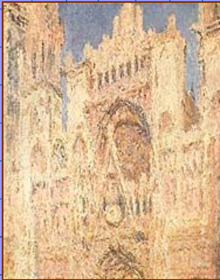
«Руанский собор в полдень»