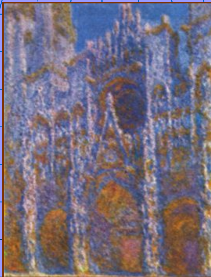
«Руанский собор вечером»