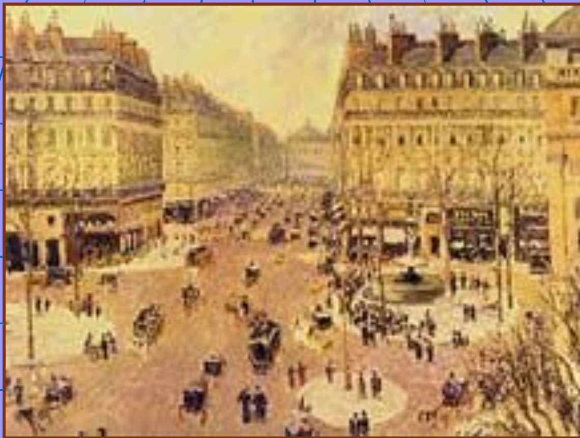
Камиль Писсарро «Оперный проезд в Париже»