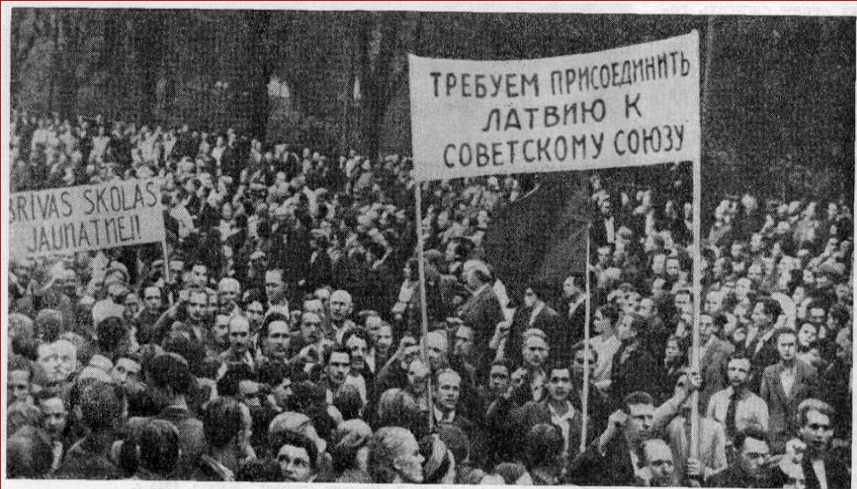
Рижане встречают советские войска летом 1940 г.

Июнь 1940 г. – отторжение от Румынии Бессарабии и Северной Буковины и присоединение их к СССР.