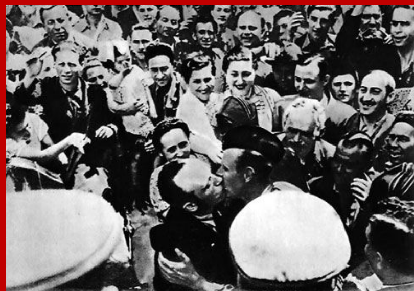
Кишинев. 28 июня 1940 года. Тысячи людей вышли на улицы, чтобы встретить Красную Армию.