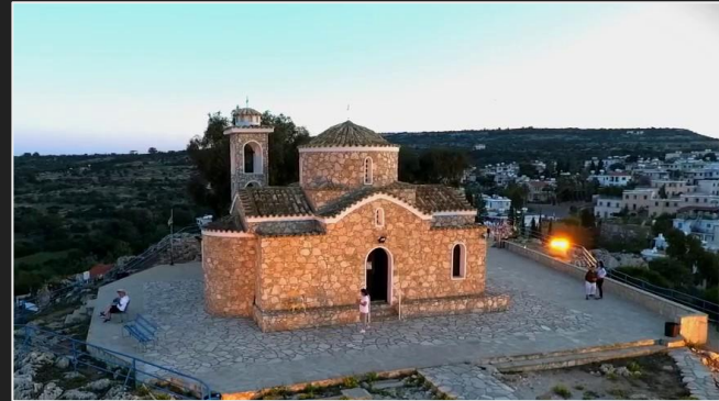
Монастырь Святого Элиаса.

Зародилось Христианство в I веке в Палестине и первоначально было распространено в среде иудеев и арамеоязычного населения в контексте мессианских движений ветхозаветного иудаизма. Уже в первые десятилетия своего существования получило распространение среди греко-римлян Сирии и других провинций, а затем среди других этнических групп. Уже во времена Нерона христианство было известно во многих провинциях Римской империи.