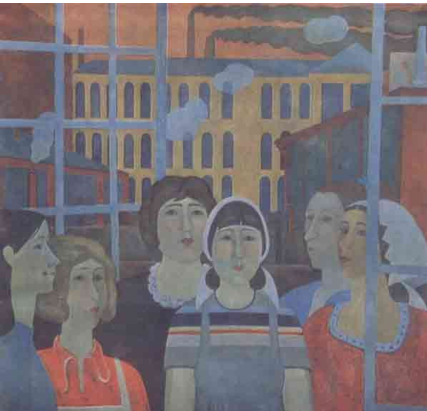
Малиновский Павел. Девушки трехгорки. 1975