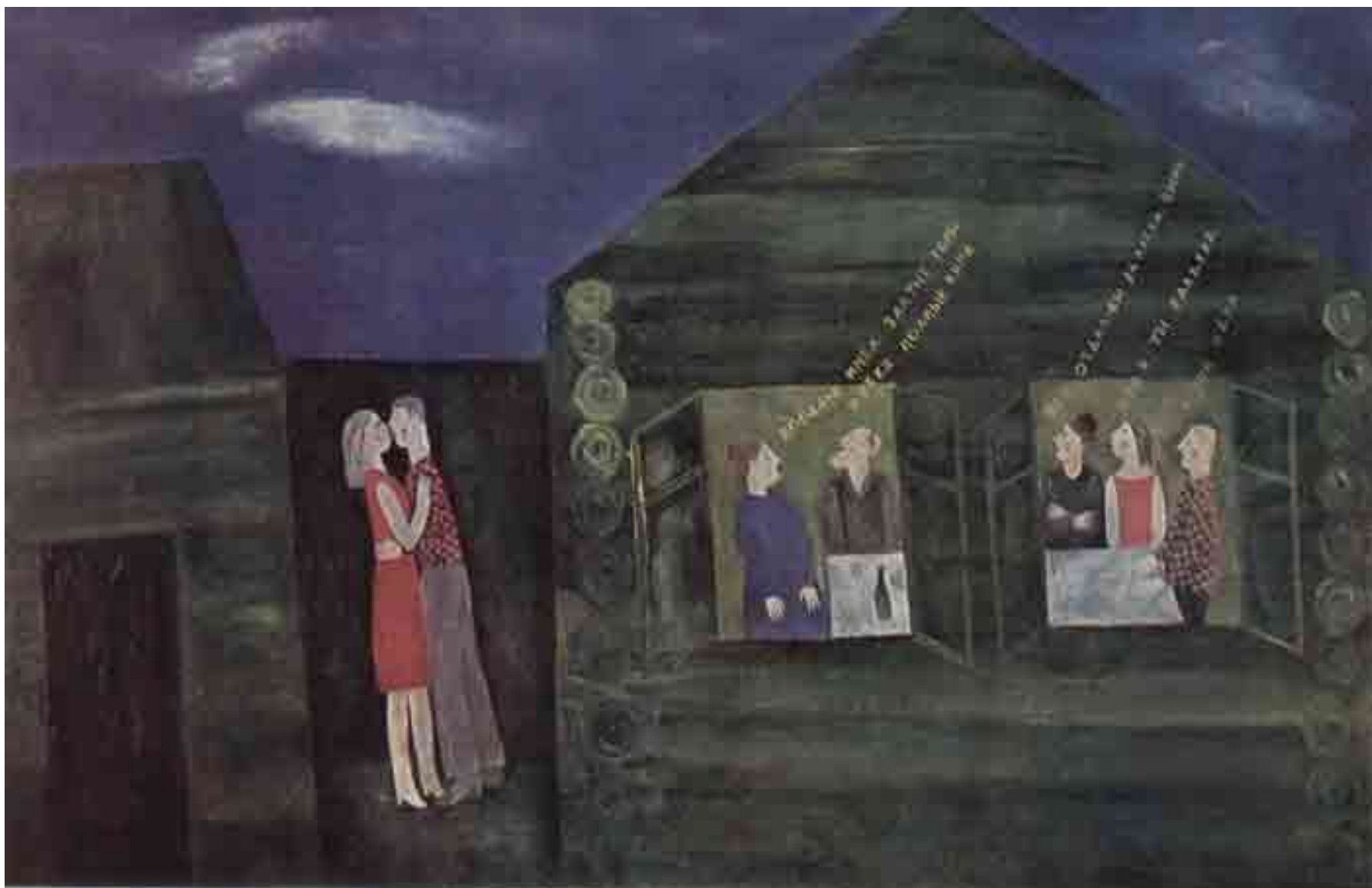
Струлев Евгений. "Прощание", 1971