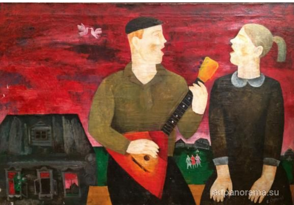
Струлев Евгений. Песня 1960- е гг.