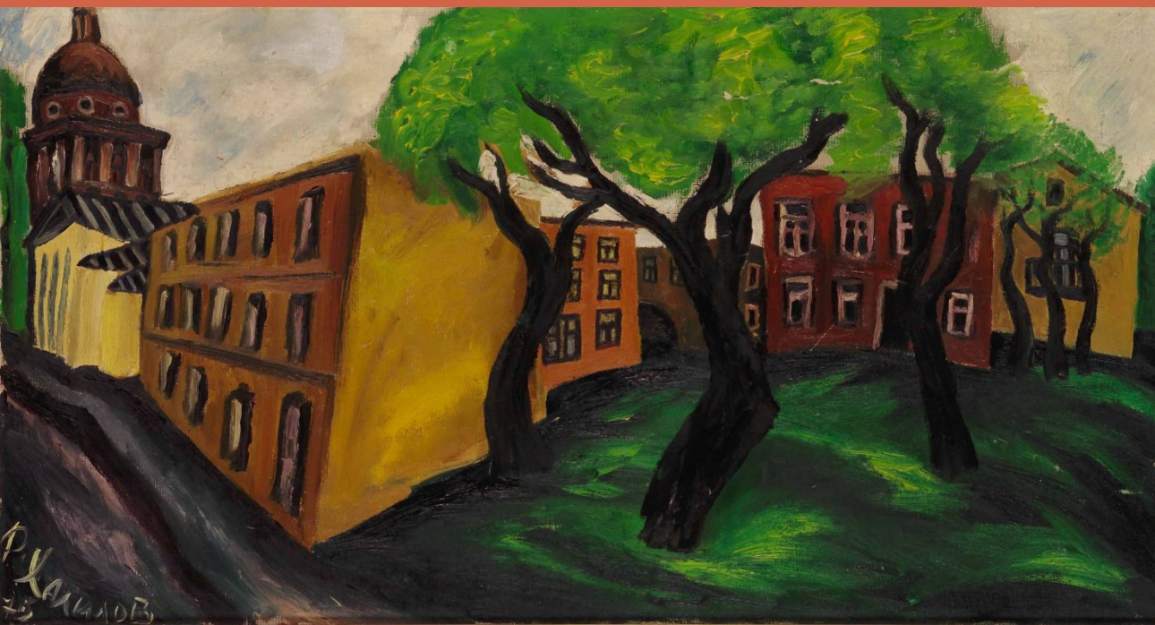
Фархад Халилов. Пейзаж. 1975