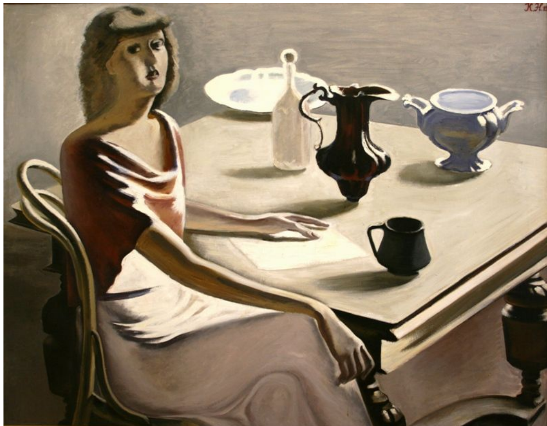
Ксения Нечитайло. Девочка с фарфором. 1985