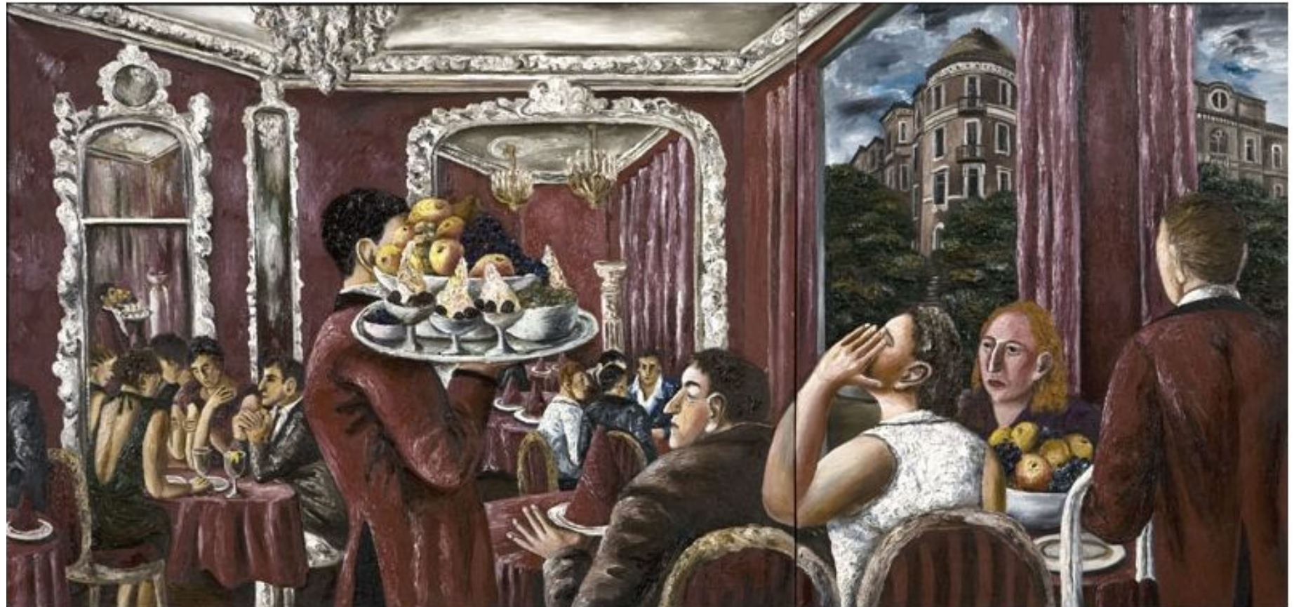
Нестерова Наталья Красный интерьер 1986