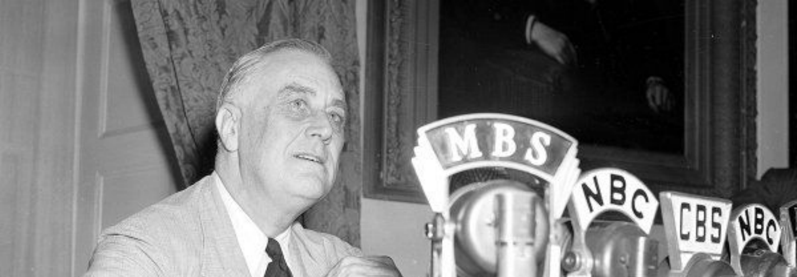
Франклин Делано Рузвельт