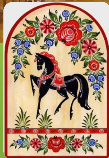
ДОСКА «ЛОБОВЕДКНЕ ЦВЕТЫ»