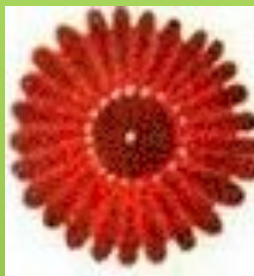
Постепенное выполнение розана