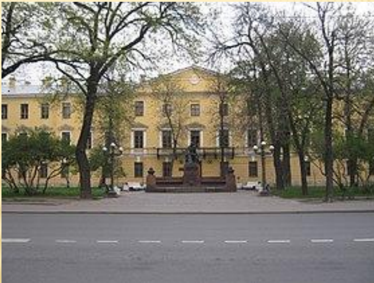
Николаевское кавалерийское училище