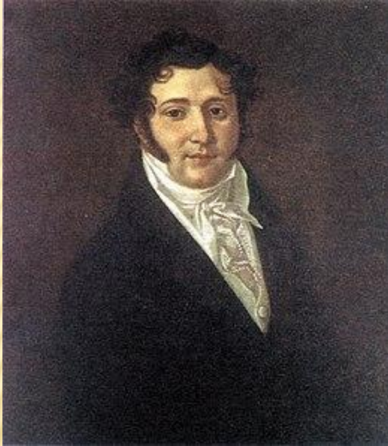
Юрий Петрович Лермонтов (1787—1831 гг.), отец поэта

ЛЕРМОНТОВ-ОТЕЦ НЕ ИМЕЛ СРЕДСТВ ВОСПИТЫВАТЬ СЫНА ТАК, КАК ТОГО ХОТЕЛОСЬ АРИСТОКРАТИЧЕСКОЙ РОДНЕ, — И АРСЕНЬЕВА, ИМЕЯ ВОЗМОЖНОСТЬ ТРАТИТЬ НА ВНУКА ВЗЯЛА ЕГО К СЕБЕ С УГОВОРом ВОСПИТЫВАТЬ ДО 16 ЛЕТ, СДЕЛАТЬ СВОИМ ЕДИНСТВЕННЫМ НАСЛЕДНИКОМ И ВО ВСЁМ СОВЕТОВАТЬСЯ С ОТЦОМ. НО ПОСЛЕДНЕЕ УСЛОВИЕ НЕ ВЫПОЛНЯЛОСЬ; ДАЖЕ СВИДАНИЯ ОТЦА С СЫНОМ ВСТРЕЧАЛИ НЕПРЕОДОЛИМЫЕ ПРЕПЯТСТВИЯ СО СТОРОНЫ АРСЕНЬЕВОЙ.