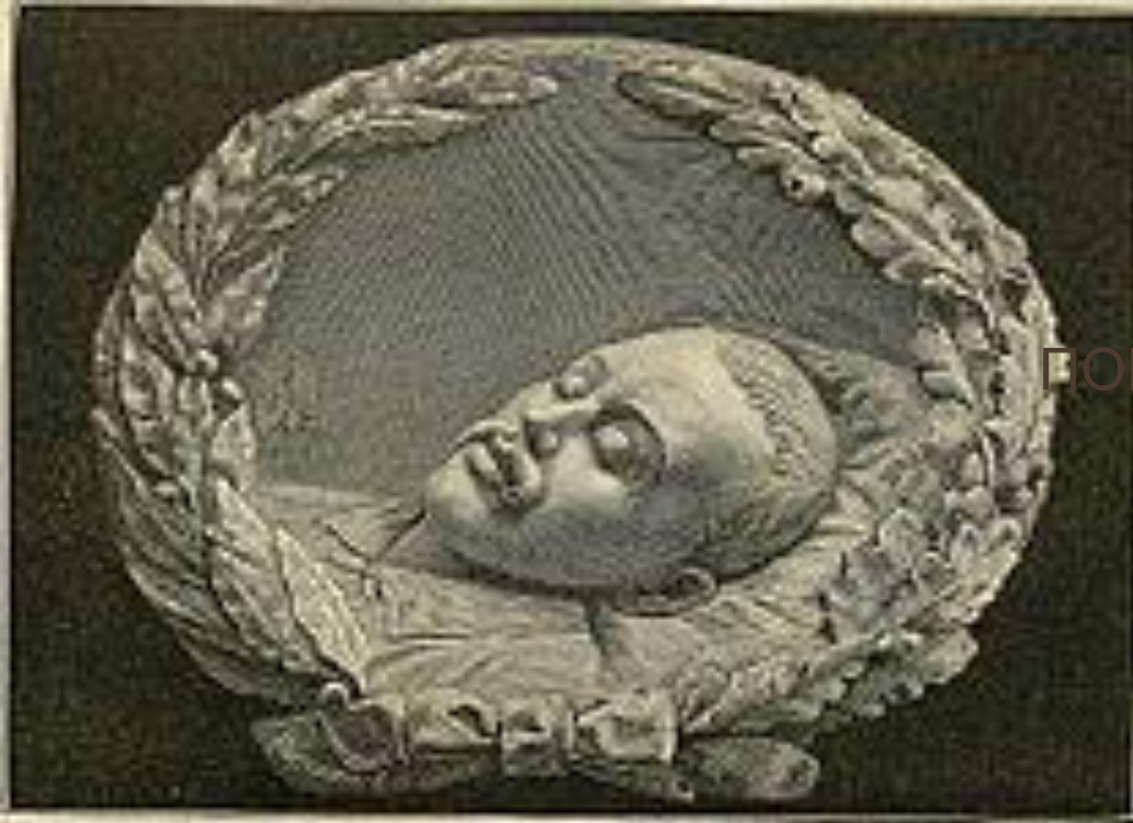
ПОРТРЕТ ЛЕРМОНТОВА В ГРОБУ.

ПОХОРОНЫ ЛЕРМОНТОВА НЕ МОГЛИ БЫТЬ СОВЕРШЕНЫ ПО ЦЕРКОВНОМУ ОБРЯДУ, НЕСМОТря НА ВСЕ ХЛОПОТЫ ДРУЗЕЙ. ОФИЦИАЛЬНОЕ ИЗВЕСТИЕ О ЕГО СМЕРТИ ГЛАСИЛО: «15-ГО ИЮЛЯ, ОКОЛО 5 ЧАСОВ ВЕЧЕРА, РАЗРАЗИЛАСЬ УЖАСНАЯ БУРЯ С ГРОМОМ И МОЛНИЕЙ; В ЭТО САМОЕ ВРЕМЯ МЕЖДУ ГОРАМИ МАШУКОМ И БЕШТАУ СКОНЧАЛСЯ ЛЕЧИВШИЙСЯ В ПЯТИГОРСКЕ М. Ю. ЛЕРМОНТОВ».