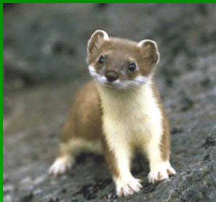
1-й вариант Горностай