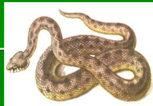
2-й вариант Гюрза