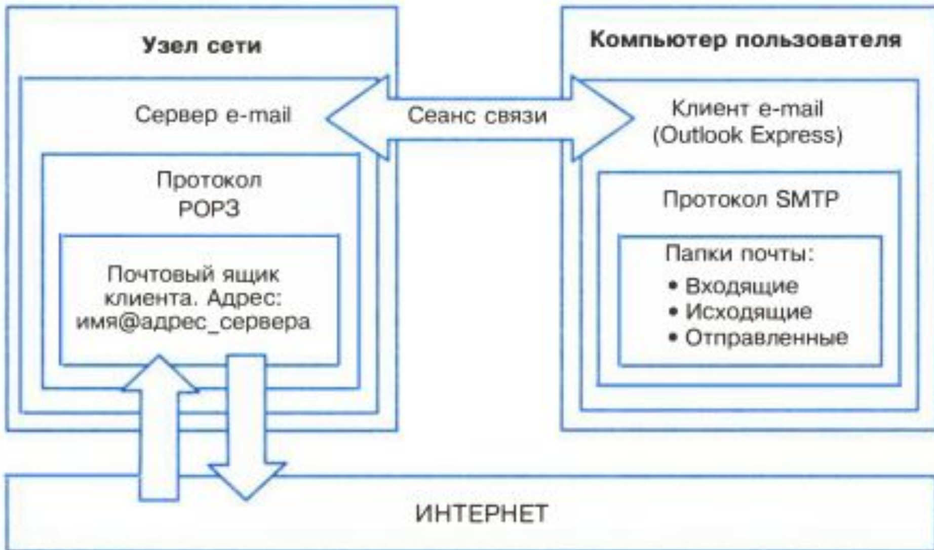
Схема функционирования электронной почты