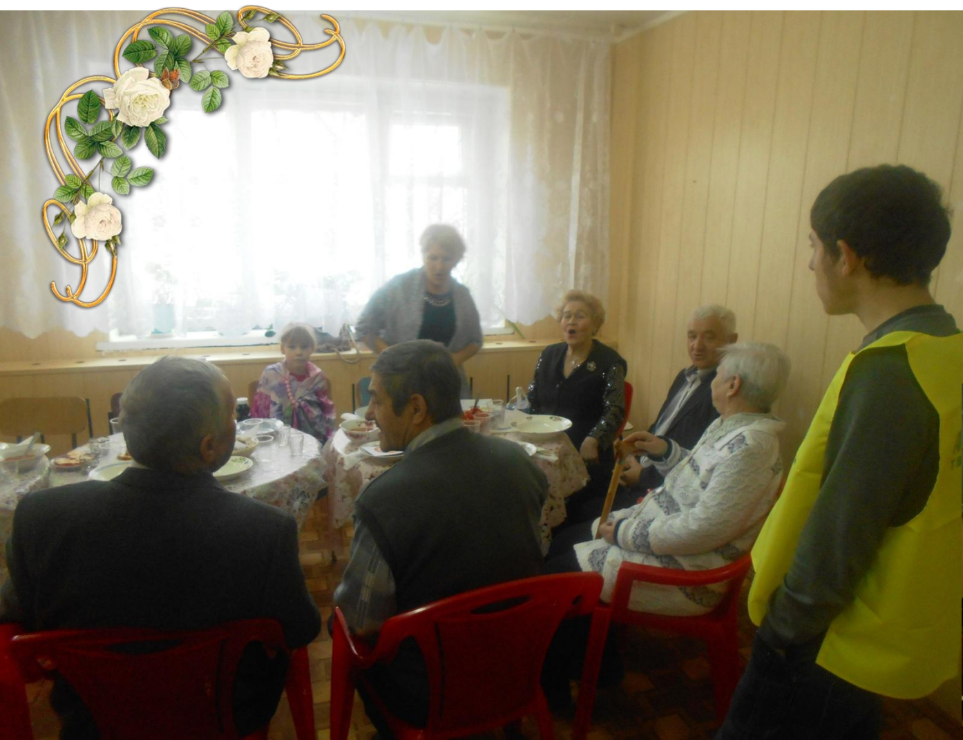
Информационный отдел ДСП «Важное дело»

В рамках мероприятий по духовно – нравственному воспитанию студентов, волонтерами ДСП «Важное дело» совместно с профкомом колледжа, для преподавателей, вышедших на пенсию, был устроен «осенний праздник», на котором звучали песни былых лет, стихи поэтов «серебряного века». За чаепитием велись душевные разговоры и воспоминания о былом. Волонтерами был подготовлен небольшой концерт для присутствующих. Вечер прошёл в тёплой и дружественной обстановке. Все остались в прекрасном настроении, несмотря на хмурый осенний день.