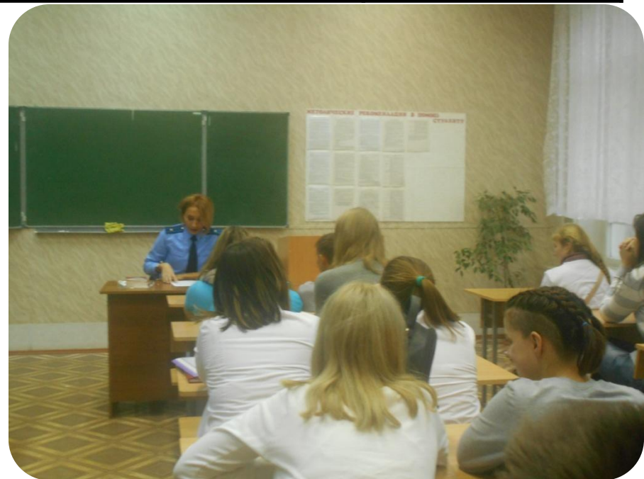
Информационный отдел Совета студенческого самоуправления

В результате диалога по данной теме были затронуты вопросы по спайсам, атрибутике и статистике по смертности, штрафам, уголовной ответственности в стране. Куда можно обратиться за помощью и на что следует обратить внимание, как вести себя в ситуации, когда происходит приобщение подростков к наркотикам – всё это горячо обсуждалось.... Основные тезисы данной встречи: «Твоё будущее – в твоих руках! Сделай правильный выбор! Скажи жизни – да, наркотикам – нет!». И все присутствующие согласились с этим. Мы говорим наркотикам – нет, потому что жизнь прекрасна и творим мы её сами.