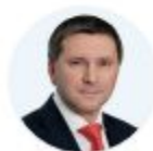
РУКОВОДИТЕЛЬ Д. Н. КОБЫЛКИН Министр природных ресурсов и экологии РФ