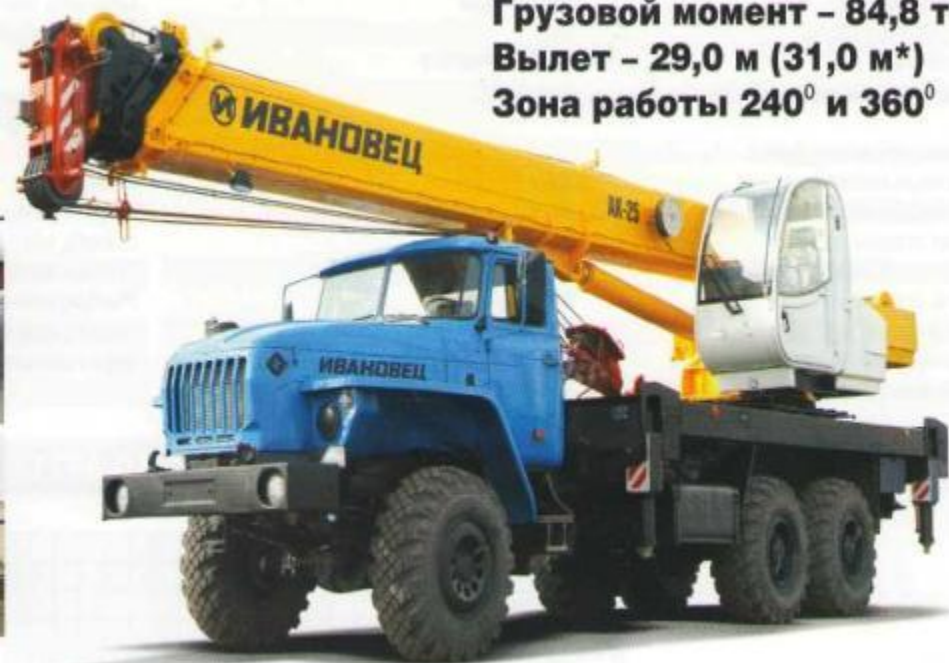
Грузовой момент – 84,8 т*м Вылет – 29,0 м (31,0 м*) Зона работы 240° и 360°