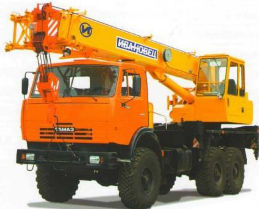
КРАН КС-35714К-2 НА ШАССИ КАМАЗ-43118