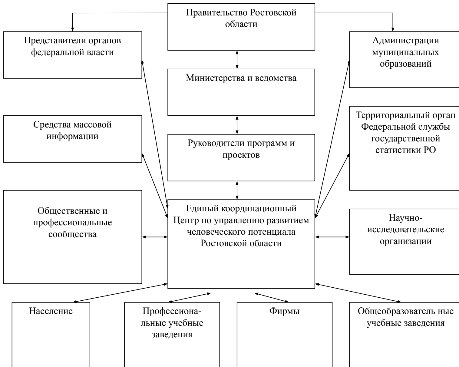
Схема взаимодействия Единого координационного Центра по управлению развитием человеческого потенциала Ростовской области с внешними субъектами