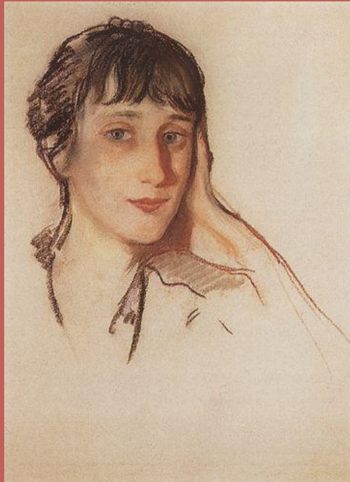
1922, Серебрякова З.Е.