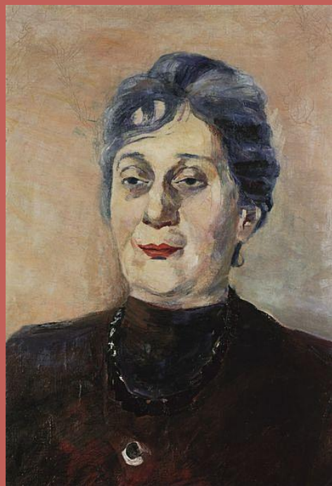
1946 Сарьян М.С.