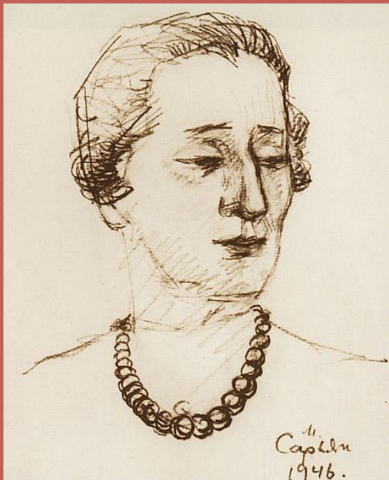
1946 Сарьян М.С.