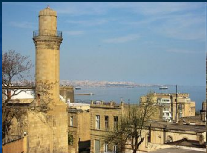
Историческая часть Баку, вид на Каспийское море