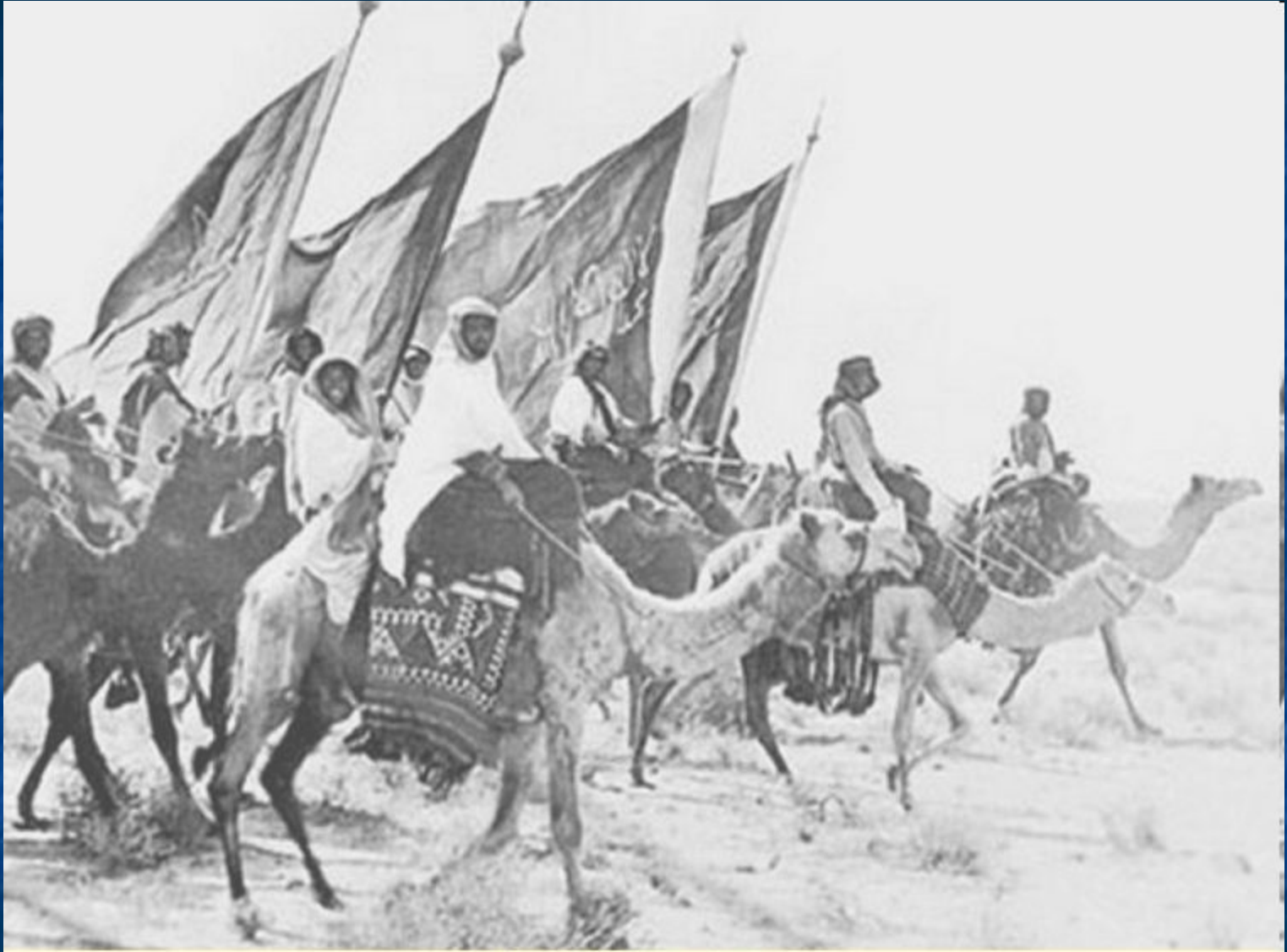
Ikhwan Army - Arabia