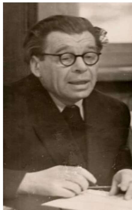
Даниил Борисович Эльконин