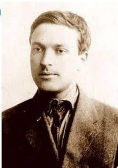
Лев Семенович Выготский