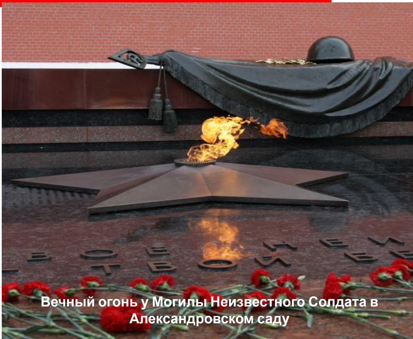
Вечный огонь у Могилы Неизвестного Солдата в Александровском саду