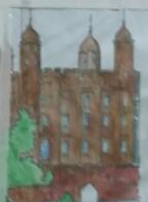
Tower of London