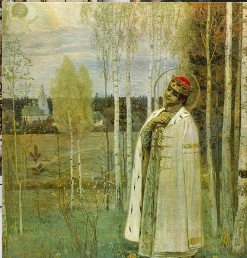
Дмитрий Иванович Углицкий