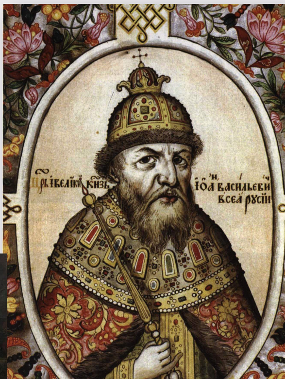
Иван IV Грозный

И. Е. Репин. «Иван Грозный и сын его Иван 16 ноября 1581 г.»