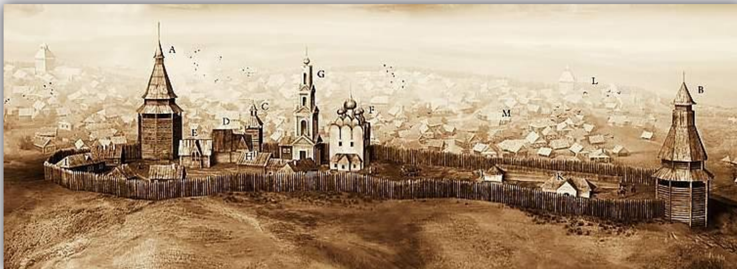
Уфимский кремль XVII—XVIII веков. Реконструкция