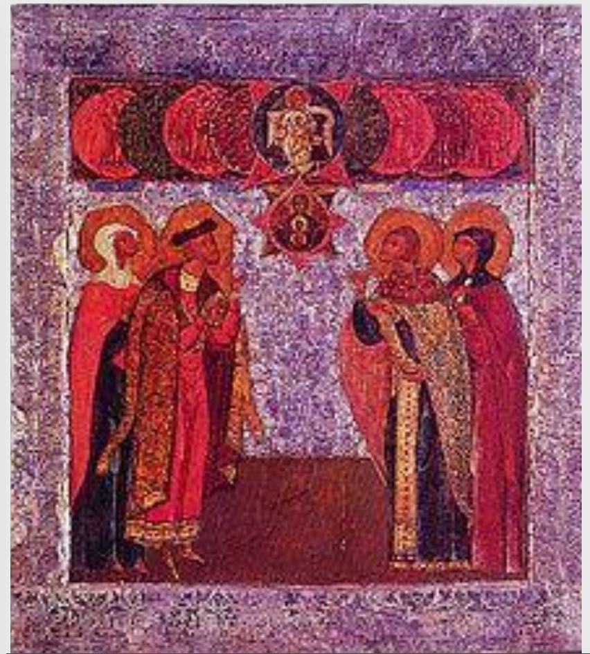
Царица Мария Григорьевна Скуратова-Бельская