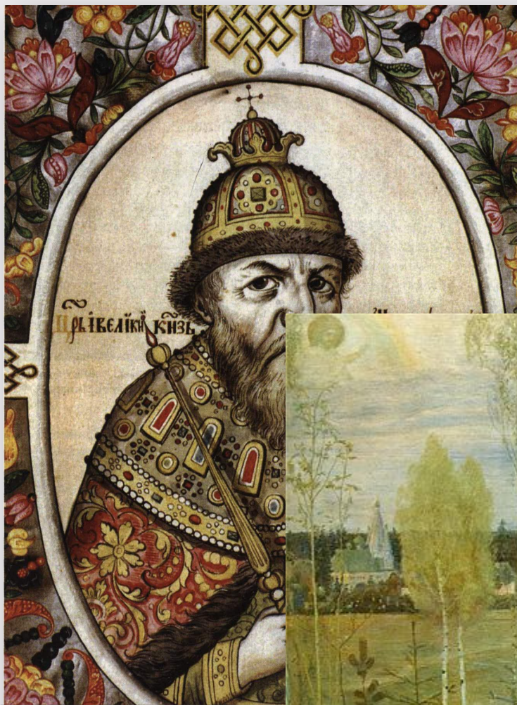
Иван IV Г