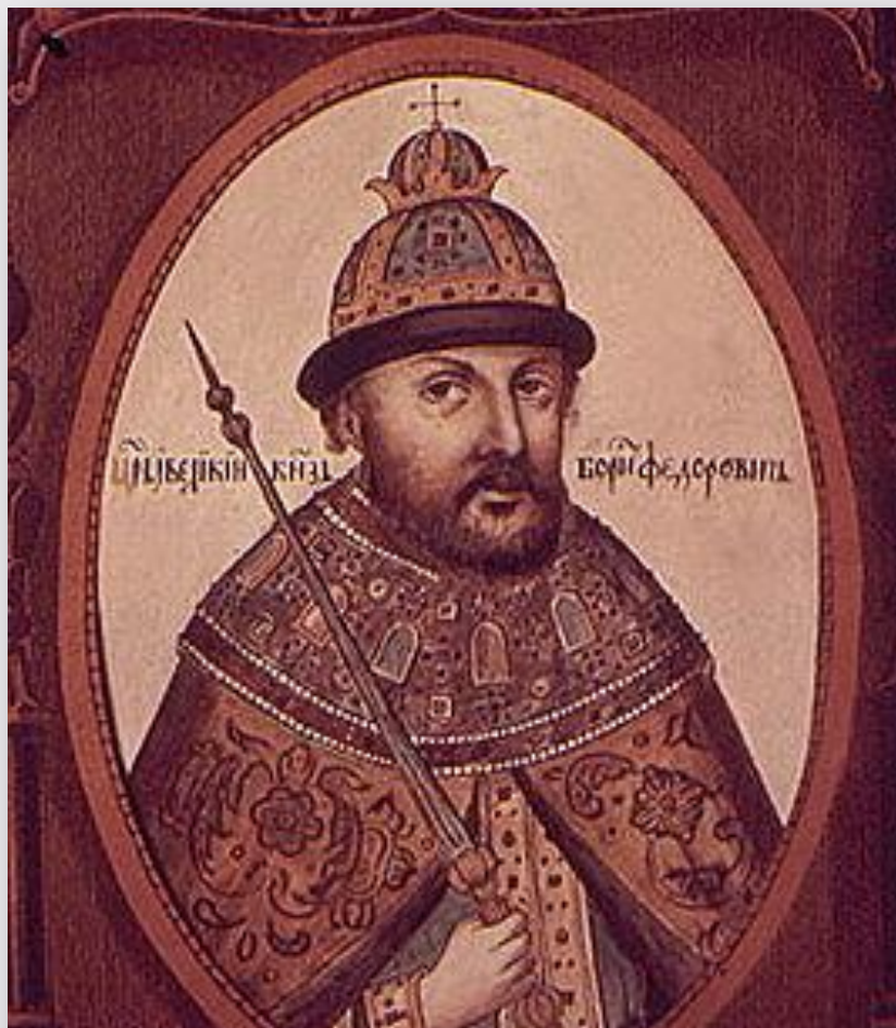
Борис Фёдорович Годунов