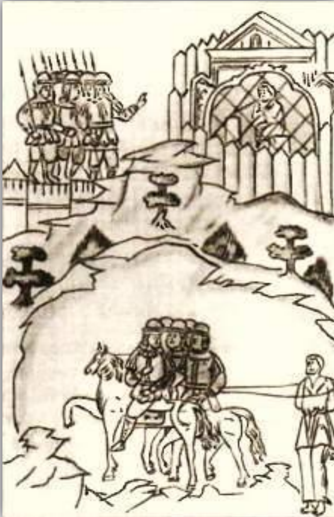
Поимка и привод беглых крестьян

Эти действия способствовали укреплению хозяйства.