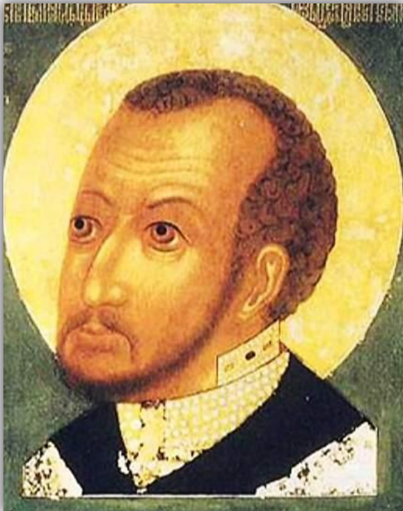
Царь Фёдор Иванович. Парсуна (портрет) XVII в.

1584 г. - после кончины Ивана IV на российский престол взошёл его сын Фёдор (1584—1598) . Он не обладал крепким здоровьем, мало интересовался государственными делами и большую часть времени проводил в молитвах. От его имени управлял боярин Борис Годунов , брат жены царя Ирины.