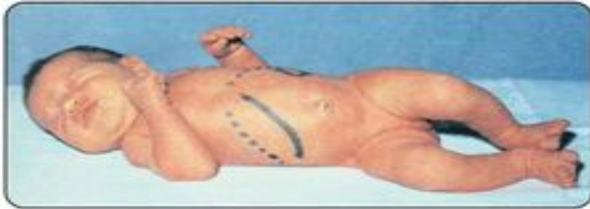
Желтуха. Печень и селезенка увеличены