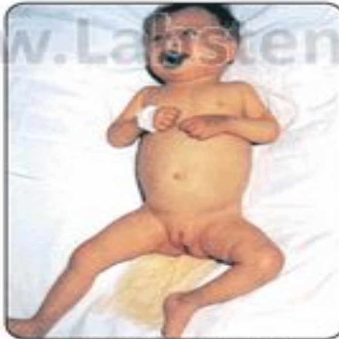
Интенсивная окраска мочи