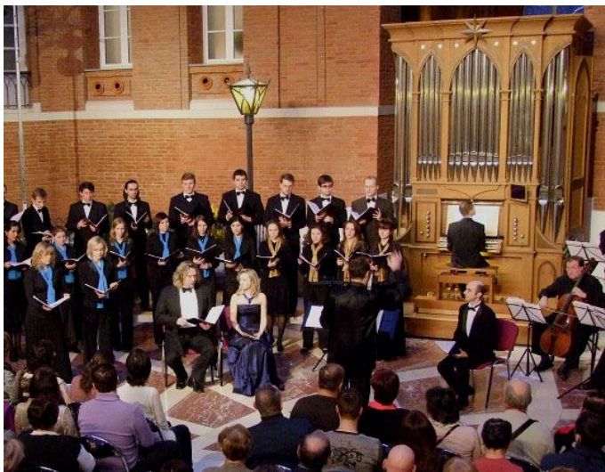
Багатоголосний спів з органом (сучасність)