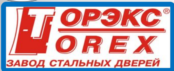
Завод стальных дверей «ТОРЭКС»